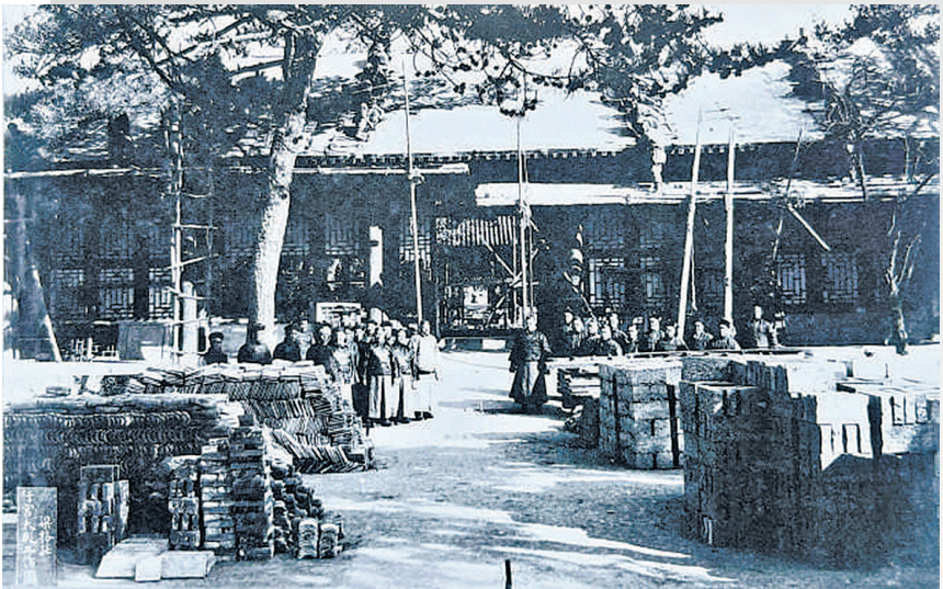
1909年初,为光绪棺槨暂安,清西陵行宫正殿正在进行改建。此后,光绪棺槨在这里停放了四年八个月。