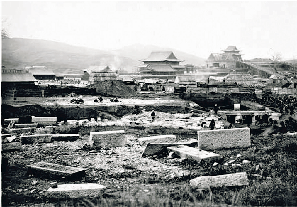
从侧面拍摄的1913年崇陵建造施工图。