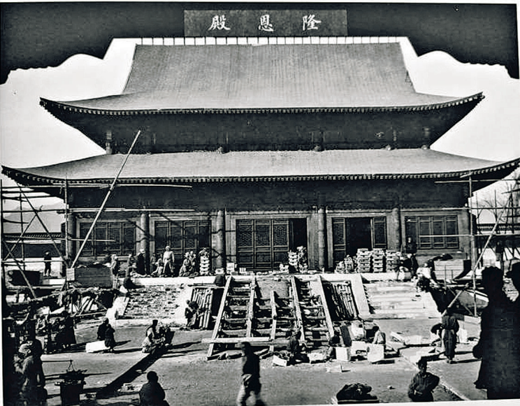
正在建设中的崇陵隆恩殿,摄于1913年。