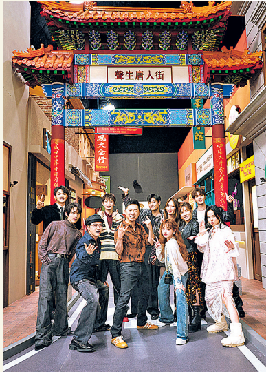
《声生不息》“华流季”嘉宾合照。

15首华语金曲串联起不同时代、不同国界的华语音乐流行印记,集中展现了中华文化向下扎根、向上盛放的强大影响力与生命力。黄丽玲与李佳薇用《世界第一等》致敬海内外同胞于世界舞台上的爱拼爱闯;庾澄庆《情非得已》、苏有朋《雨蝶》、汪苏泷《像晴天像雨天》、颜人中《一直很安静》、黄霄雲《此生不换》勾勒出国产影视剧留给海内外观众的亚洲集体情感回忆;《酒醉的熊猫》《叹·伯虎说》《月光爱人》《生来倔强》等歌曲展现了越来越多的华语歌手和海外音乐人的精彩“过招”。此外,首期节目用欧阳靖在美国曼哈顿唐人街街头演绎的《华人万岁》衔接全场观众大合唱开场,又用张信哲在世界巡演