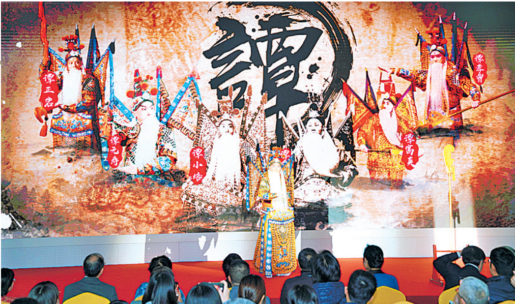
开幕现场,谭正岩带来京剧表演。