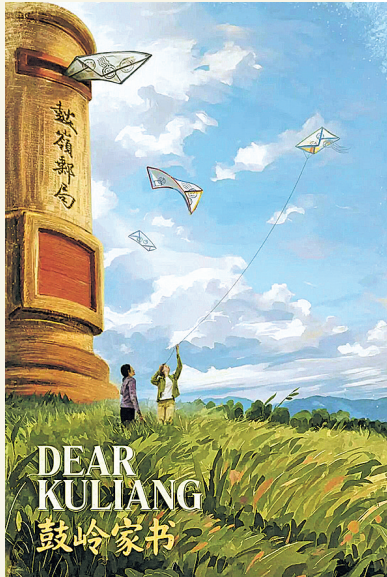
纪录片《鼓岭家书》海报。