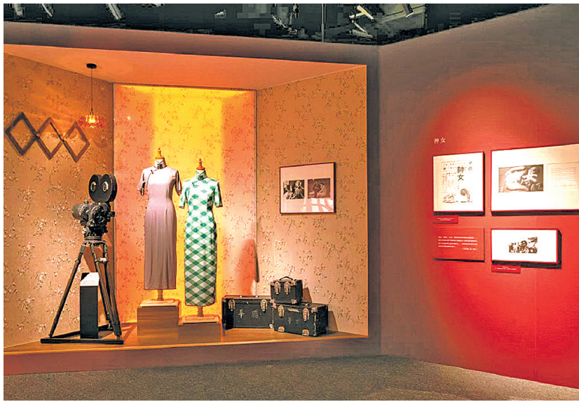
特展展现了上海电影发展历程、经典作品创作以及电影之城建设风采。

“戏曲电影的发展一直伴随着中国电影史,从《定军山》到《四郎探母》《梁山伯与祝英台》等,中国电影无声、有声、黑白、彩色等技术发展都是以戏曲电影为路标,戏曲虚实结合以