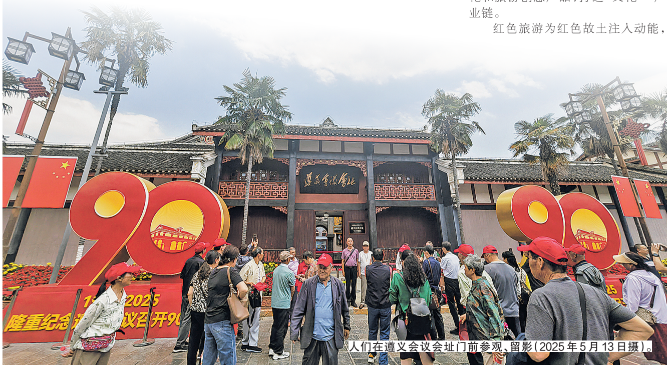
人们在遵义会议纪念馆门前参观、留影(2025年5月13日摄)。