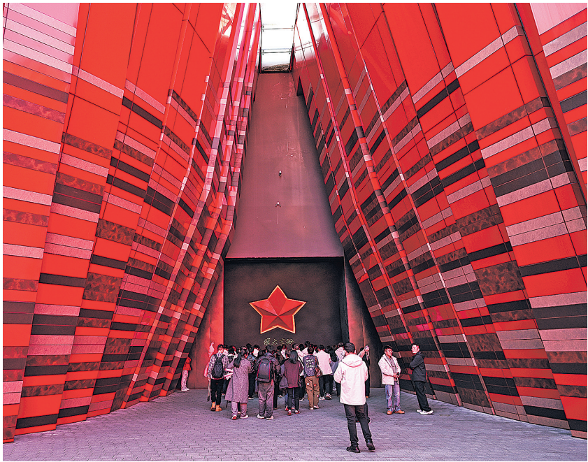
游客在贵州长征文化数字艺术馆——“红飘带”外参观(2025年11月15日摄)。

据贵州省委宣传部相关负责人介绍,贵州以长征国家文化公园建设为契机,建立红色资源保护管理利用工作联席会议机制,统筹协调重点红色纪念场馆保护研究、展示利用等工作,首批25个重点红色纪念场馆纳入管理。