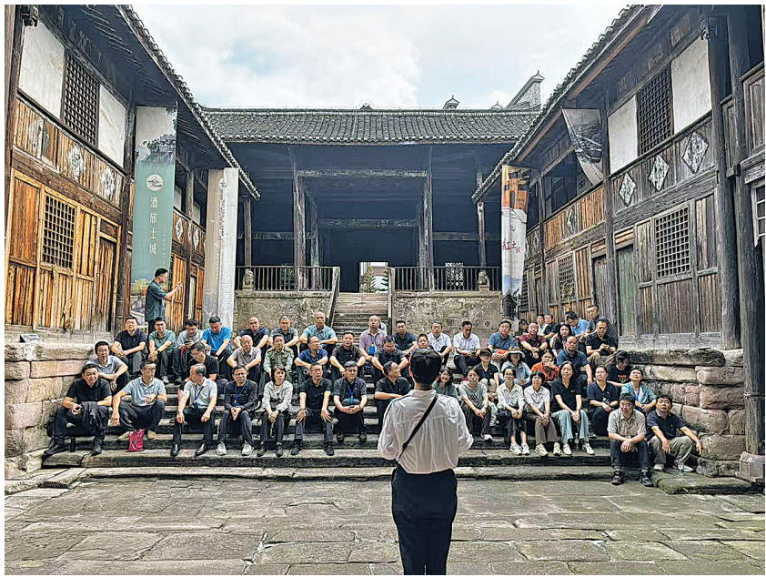
在遵义市习水县土城镇惠民宫内,党员干部参与红色培训(2025年9月17日摄)。

厚重红色记忆,正在西南沃土持续浸润着人们的心灵,成为引领一代代年轻人的价值坐标。历史的回响与时代的脉搏同频共振,凝聚奋进的力量。