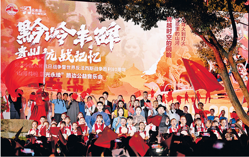
在贵阳市云岩区文昌阁日暮广场举办的主题为“黔岭丰碑 贵州抗战记忆”的路边公益音乐会(2025年8月22日摄)。