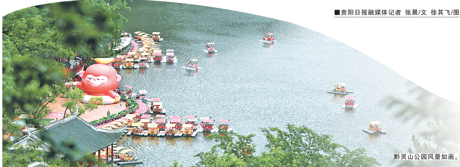
黔灵山公园风景如画。

生态文明建设功在当代、利在千秋。展望“十五五”,贵阳上下将深入践行习近平生态文明思想,坚持生态优先、绿色发展,持续打好“生态牌”、走好“绿色路”、绘好“美丽卷”,黔中大地将越发多姿多彩,绿水青山将源源不断地释放生态红利。