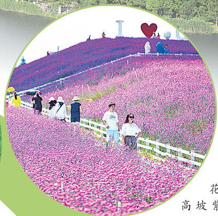
花溪高坡紫色花海。

征程万里风正劲,重任千钧再启航。站在新的历史起点,面向“十五五”的壮阔蓝图,贵阳将以更加坚韧的担当扛起时代赋予的使命,继续锚定生态立市战略不动摇,让绿色动能更加澎湃,让发展成色更加纯净,奋力谱写人与自然和谐共生、经济与生态相得益彰的崭新篇章,让“绿水青山”与“金山银山”交融并进的生动实践,闪耀于时代潮头。