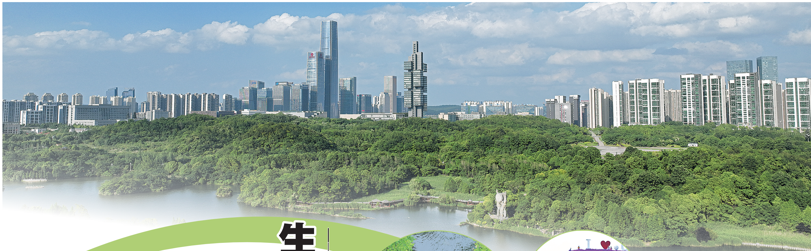
生态环境优美的贵阳城区一角(资料图片)。

“十四五”壮阔航程已近终点,五年时间,千历史长河不过一瞬,于贵阳而言,却是一段镌刻荣光、饱含温情的征程。