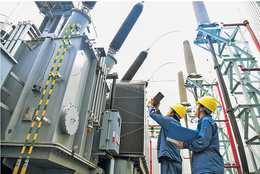
今年国庆中秋假期,在贵安新区高峰镇110千伏青鱼变电站,贵安供电局工作人员在对变电站设备进行测温及数据记录。

聚焦民生福祉,服务质效与创新赋能实现双突破。“十四五”以来,该局始终保持“零事故、零伤亡”纪录,2024年在全省率先迈入客户平均停电“1小时”