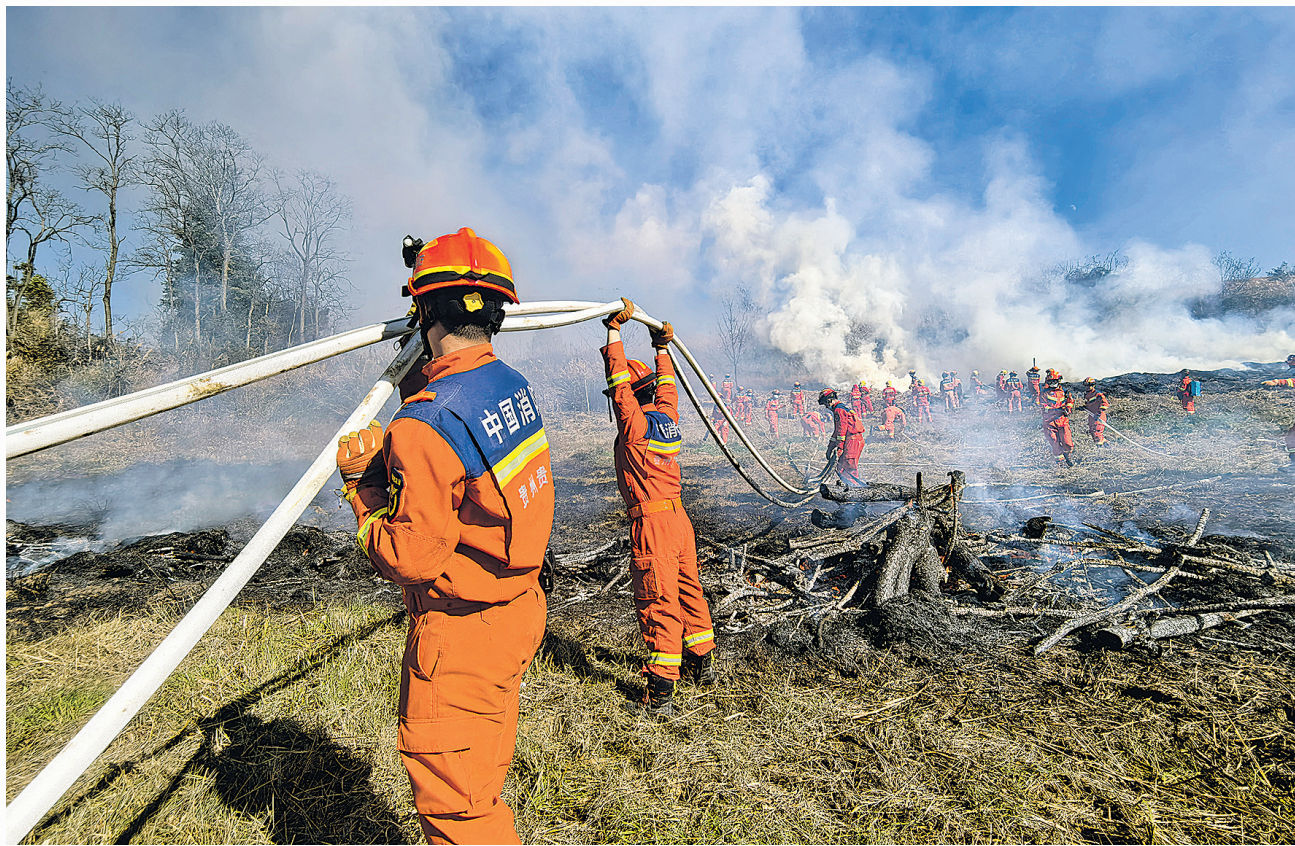
消防救援人员在演练中架设水管,以此压制蔓延的火势。

本报讯 “报告指挥长!活龙村林区突发火情,火势正快速向周边林地快速蔓延!”11月28日14时10分,贵安新区高峰镇山林间浓烟骤起,一场紧贴实战的森林火灾应急演练正式打响。