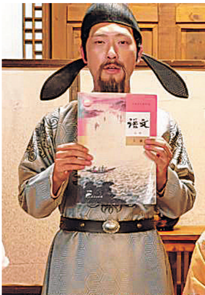
郝家豁拍摄的短剧剧照。