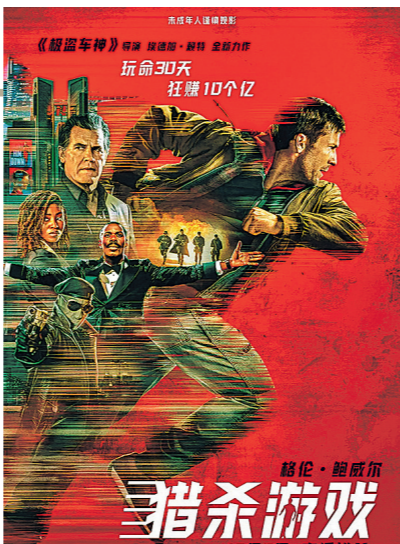
《猎杀游戏》宣传海报。