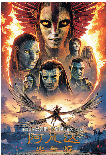
《阿凡达:火与烬》宣传海报。