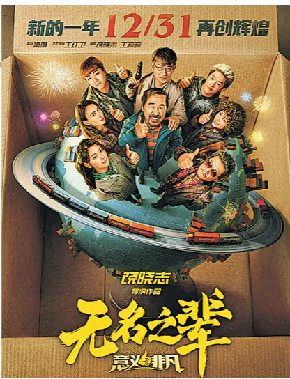
《无名之辈:意义非凡》宣传海报。