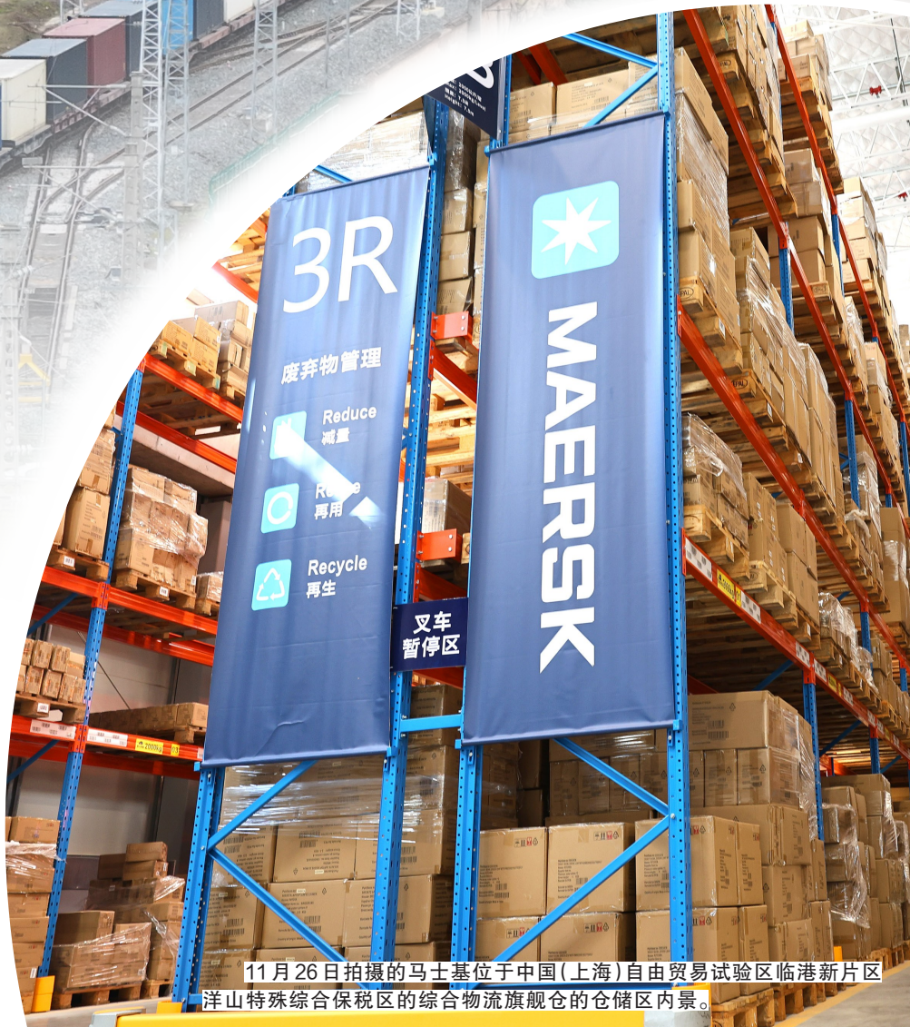
11月26日拍摄的马士基位于中国(上海)自由贸易试验区临港新片区洋山特殊综合保税区的综合物流旗舰仓的仓储区内景。

11月17日，X9043次中欧班列(西安)驶出西安国际港站，驶向阿塞拜疆首都巴库(无人机照片)。