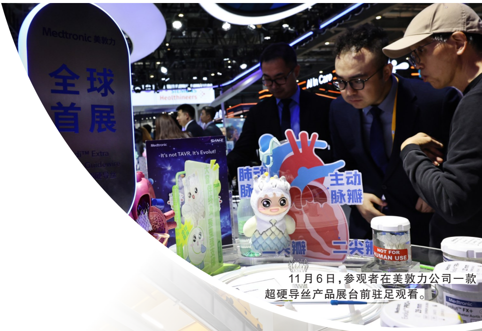
11月6日，参观者在美敦力公司一款超硬导丝产品展台前驻足观看。