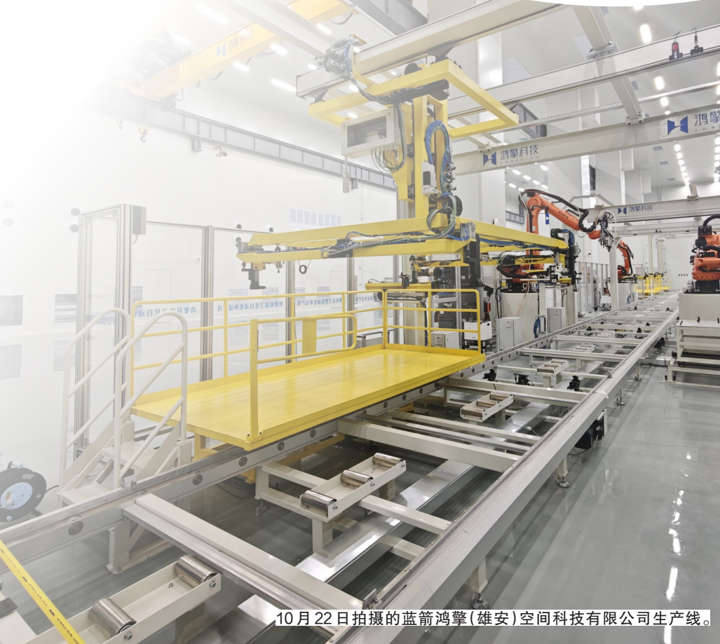
10月22日拍摄的蓝箭鸿擎(雄安)空间科技有限公司生产线。