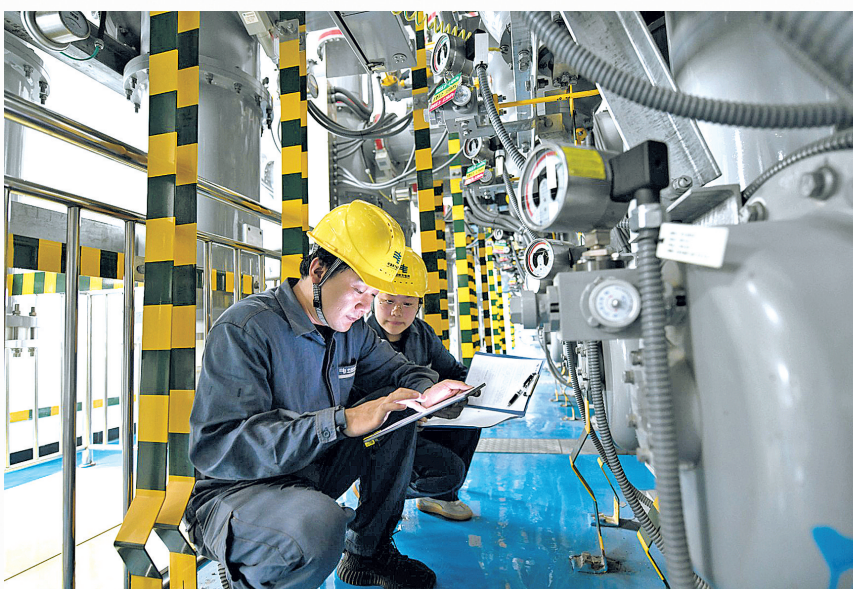
贵安供电局工作人员在检查变电站设备。

聚焦这一行业痛点,贵安供电局秉持“科技赋能、主动防御”理念,深度融合前沿技术与电网运维实际,牵头开展技术攻关,成功研发出多项行业领先的创新成果。如采用多极化InSAR技术,显著提升复杂地形下形变监测的精度与密度;构建的基于机器学习的地面形变预测模型,实现了对沉降风险的精准研判。其中,贵安供电局构建的“空-天-地”一体化智能监测体系,有效整