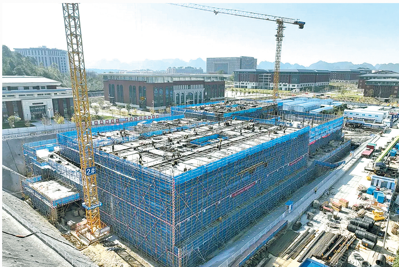
贵州医科大学新宿舍项目施工现场。