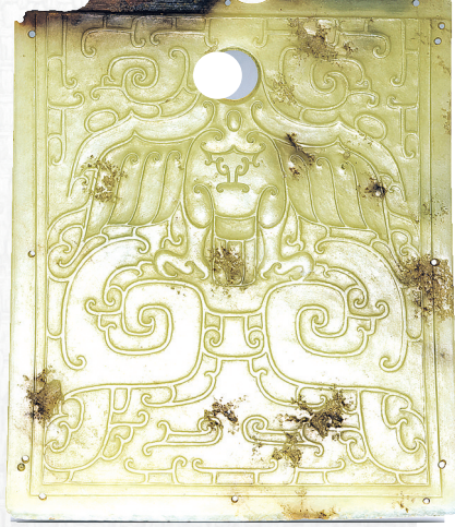
石峁遗址墓葬出土的鹰纹玉钺(正面)。

就越大。“高等级墓葬中出土的陶明器和玉器尤被学界关注,陶器一般为盃(罍)、瓶、盆(壶)、杯组合,这些器类在石峁文化居址中都可见到。玉器主要有钺和环,其中一件鹰纹玉钺保存完好,一面减地刻出繁复的翔鹰和人(神)面形象,是目前所见石峁文化遗址出土玉器中最为精美者。”邵晶晶说。