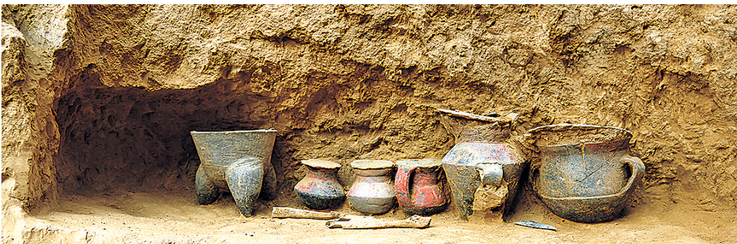
石峁遗址墓葬M13壁龛器物。