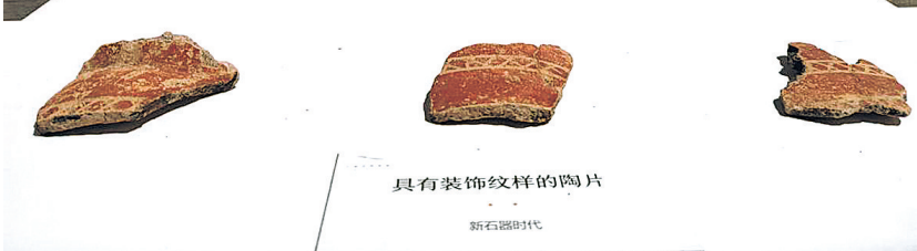
黄山上遗址出土的跨湖桥文化时期的陶片。

来自“浙西南、闽北、赣东先秦考古学术研讨会”上的消息,“十四五”期间浙西南区域系统调查成果丰硕,填补了这一地区先秦考古的诸多空白。