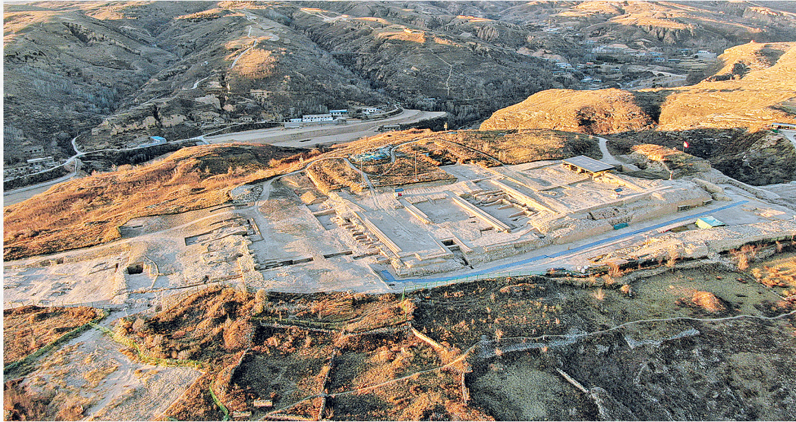
位于陕西神木的史前城址石峁遗址。

“研究团队与考古发掘保持同步,第一时间获取最新、最具代表性的样本。这种坚持使我们最终能给出一个足够综合与复科学的科学解