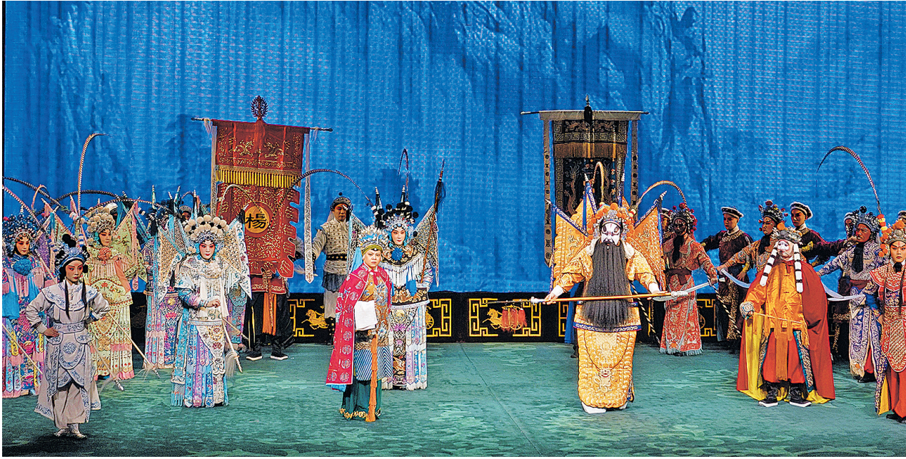
京剧《杨门女将》演出剧照。

人才特殊培养模式,成为中国戏曲界和戏曲教育界重要的文化品牌,是“中华优秀戏曲文化传承体系”的重