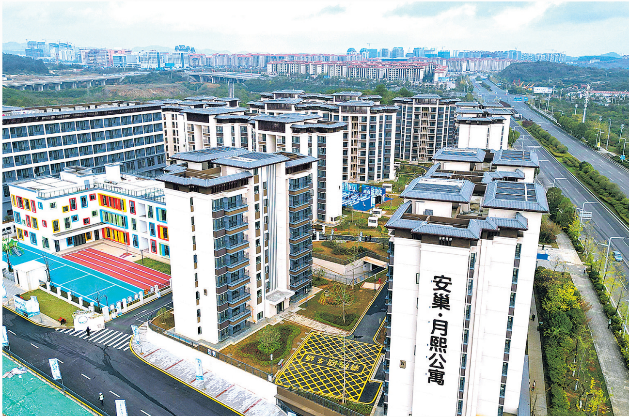
俯瞰安巢·月照公寓。

本次获奖的两个公寓项目，是贵安新区“安巢公寓”品牌的优秀代表。2024年8月，在高质量发展引领下，作为新区产城融合综合服务商的贵安发展集团积极探索人才住房保障，旗下贵州贵安商业资产管理有限公司确立“安巢”核心品牌，紧扣“人才兴市”战略与产城融合大局，加快打造“月·云·星”梯度品牌体系，形成“免费住、补贴租、高品质租住”的多层次住房保障链。例如，安巢·星耀、安巢·云澜公寓的“免费住”政策为应届毕业生降低安居门槛，安巢·月照、安巢·云柏公寓等以高品质住房满足不同发展阶段人才的需求。如今，安巢公寓项目已全面覆盖新区“三城两组团”战略规划板块，累计为逾3万名青年人才提供安居服务。其中，安巢·云柏公寓的出租率从开业