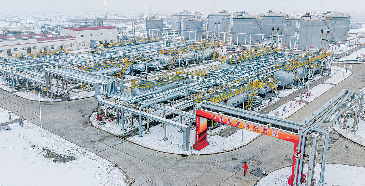
中国石油集团12月9日发布消息,我国首个国家级陆相页岩油示范区——新疆吉木萨尔国家级陆相页岩油示范区今年原油产量突破170万吨,标志着其国家级示范工程建设任务全面完成。

图为12月8日拍摄的新疆吉木萨尔国家级陆相页岩油示范区中国石油新疆油田页岩油联合站(无人机照片)。