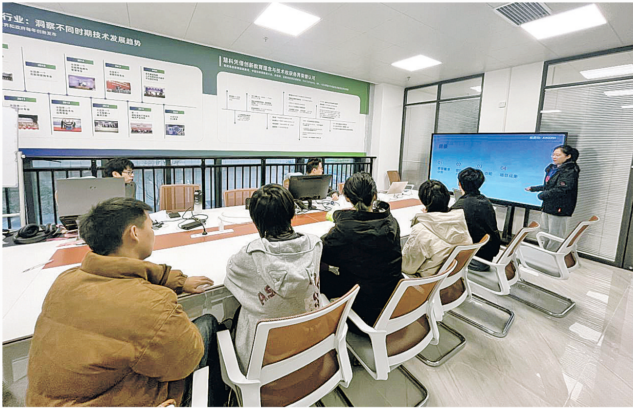
实训基地例会上,学生们在商讨项目进度。

编码开发阶段是实训的核心环节。6周的时间里,学生们每天遵循“上午汇报—下午攻坚—晚上复盘”的节奏推进。其间,导师会聚焦当日突出问