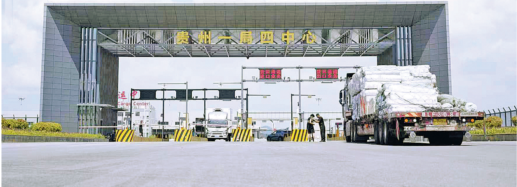
一辆货车驶入贵州“一局四中心”。

贵州双龙保税物流中心(B型)和贵州国际空港物流集配中心两大平台的同步启用,为贵州深度融入西部陆海新通道和“一带一路”建设注入强劲动能,标志着贵州双龙航空港经济区对外开放迈入系统集成、功能协同的新阶段,全省内陆开放航空口岸能级实现跨越式提升,将有力推动临空偏好型产业集聚,促进跨境电商、冷链物流、高端制造、生物医药等产业蓬勃发展,为地方经济注入新的强大动能。