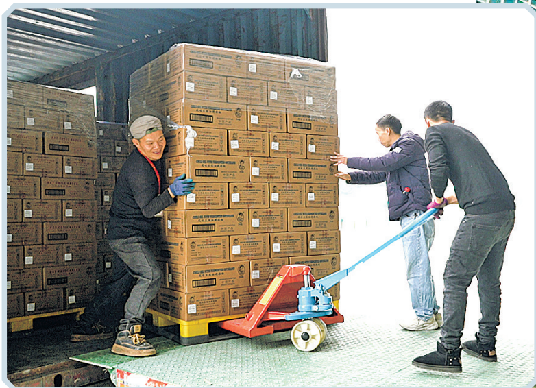
老干妈辣椒制品通过贵州双龙保税物流中心(B型)对外出口。