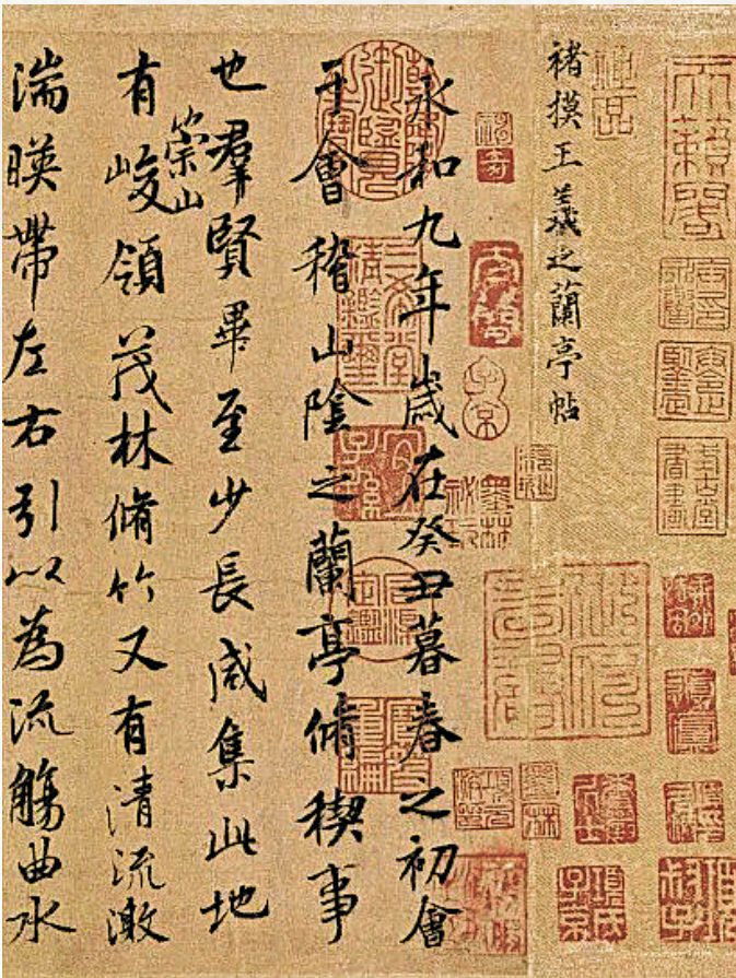
书中插图《兰亭集序》。

黄德宽:作为第一部系统分析解说汉字的著作,《说文解字》的问世,既是许慎个人的伟大学术创造,也是他所处的那个时代语文学研究成果的集中呈现。这部著作的出现,标志着中国文字学的正式创立,并影响了此后近两千年中国文字学发展的走向。历代的字书编纂、文字研究以及文字规范与教育等,几乎都以它为基本依据和标准。不仅如此,随着学术研究的推进,《说文解字》本身也早已