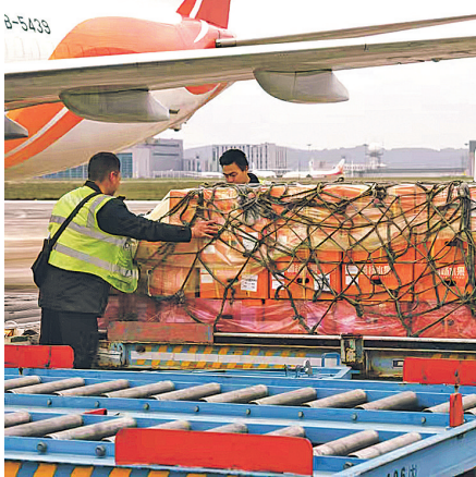
通过贵州“一局四中心”之一国际货运中心引进的境外生鲜。

贵州双龙航空港经济区锚定“集聚发展、提质增效”目标,通过优化营商环境、强化政策扶持,精准招商引资,推动贵阳空港型国家物流枢纽内的物流主体加速集聚、产业集群蓬勃发展。