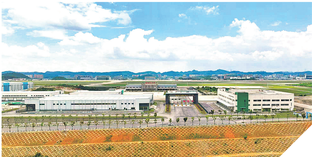
俯瞰贵州“一局四中心”。

贵阳空港型国家物流枢纽由口岸物流区、临空物流区、航空货运区三大功能区组团构成,形成了功能协同匹配、业务联动发展的总体格局。为建设好这座国家物流枢纽,贵州双龙航空港经济区严格对标国家建设要求,聚焦运营成效、联网运行等核心维度,从体制机制、多式联运、项目建设、绿智转型、产业集聚等方面精准发力,推动枢纽跑出建设“加速度”,各项工作取得阶段性成效。