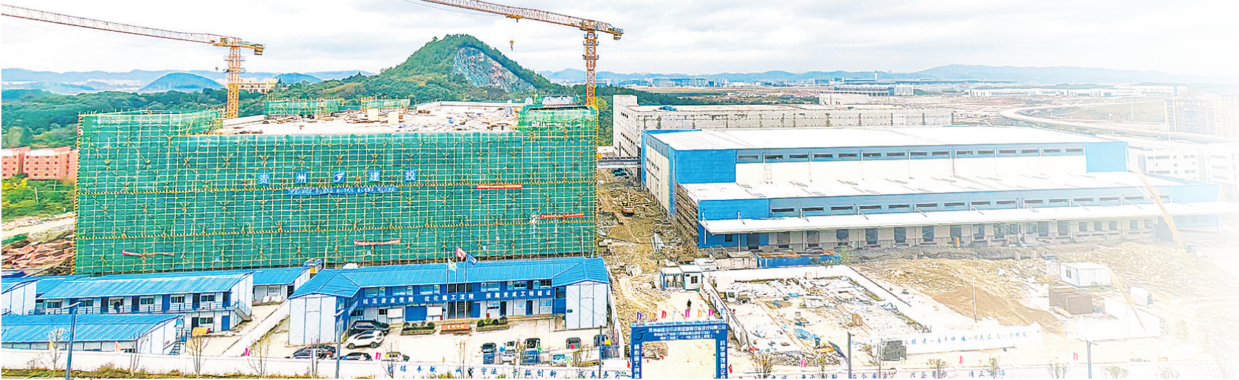
贵州省农产品现代流通运营总部项目建设现场。