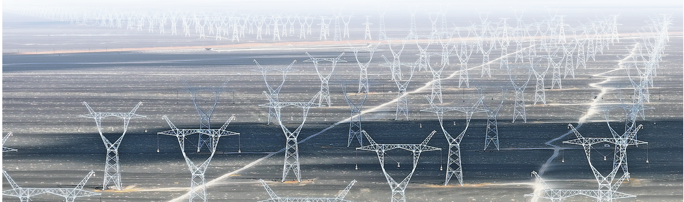
2025 年 4 月 24 日在新疆哈密地区三塘湖镇附近拍摄的“疆电入渝”特高压工程(无人机照片)。

甘巴尔代拉说,展望未来,世界将见证一个更加数字化、更可持续、与世界深度联通的中国。中国正从“世界工厂”加速迈向“全球创新实验室与绿色引擎”,必将为全球经济长远发展持续作出自己的贡献。