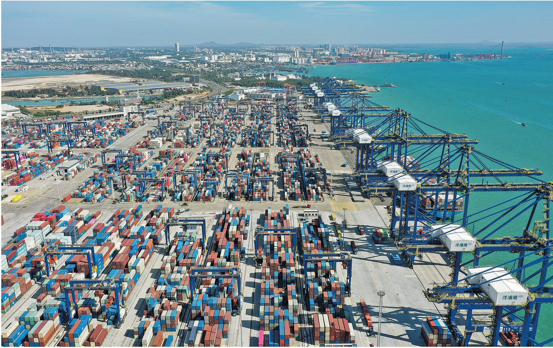
2025 年 11 月 28 日拍摄的海南洋浦港。该港是海南自贸港 10 个“二线口岸”之一(无人机照片)。

岁暮天寒,暖意东来。 中央经济工作会议日前在北京闭幕,世界再次聚焦中国经济巨轮的前行方向。海外人士认为,此次会议不仅着眼“十五五”开局为中国经济把脉定向,也为世界经济提供稳定预期、创新动能和机遇清单。在充满不确定的世界,国际社会瞩目中国继续担当全球经济增长的重要引擎,为世界注入强大确定性。