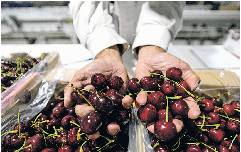
2024 年 1 月 4 日,工人在智利拉斯卡夫拉斯市的水果包装厂内展示车厘子。