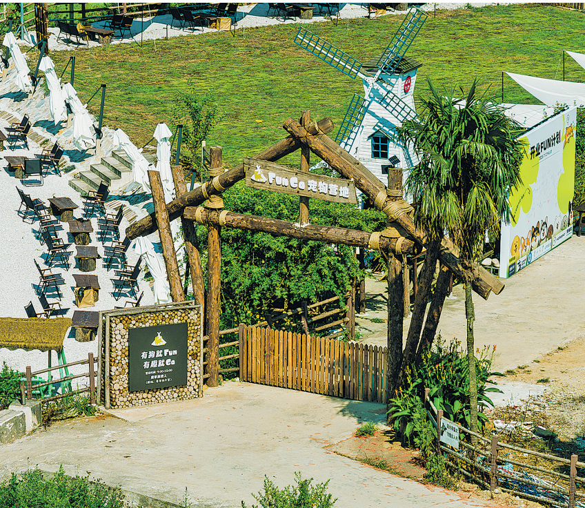
Fun Go 宠物营地一角。