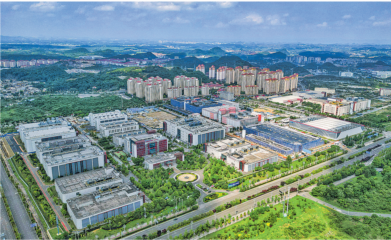
俯瞰马场产业新城。

在“怎么招”方面,贵安综保区围绕产业链招商,结合保税维修再制造、光电显示、光电照明产业集群发展现