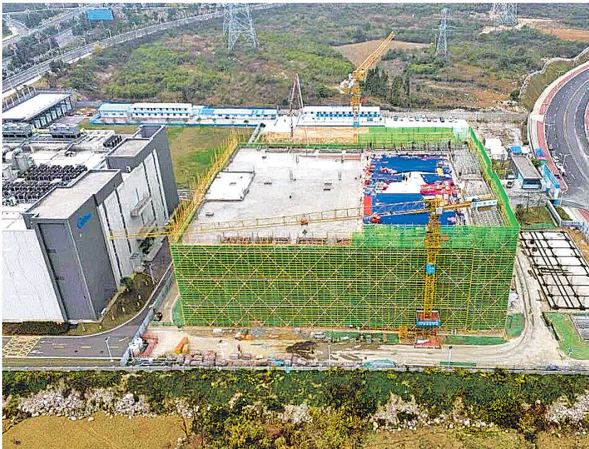
俯瞰主体结构封顶的贵安美的云项目一期B栋数据中心。