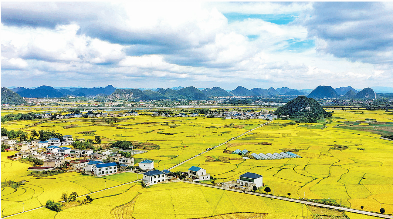
秋日龙宝美如画。

好产品不愁口碑,却曾受困于销路。为推动农产品从“好品质”向“好品牌”“好效益”升级,今年8月,驻村工作队助力龙宝村推进品牌化运作,完成龙宝大米专属包装设计与二维码溯源体系建设。