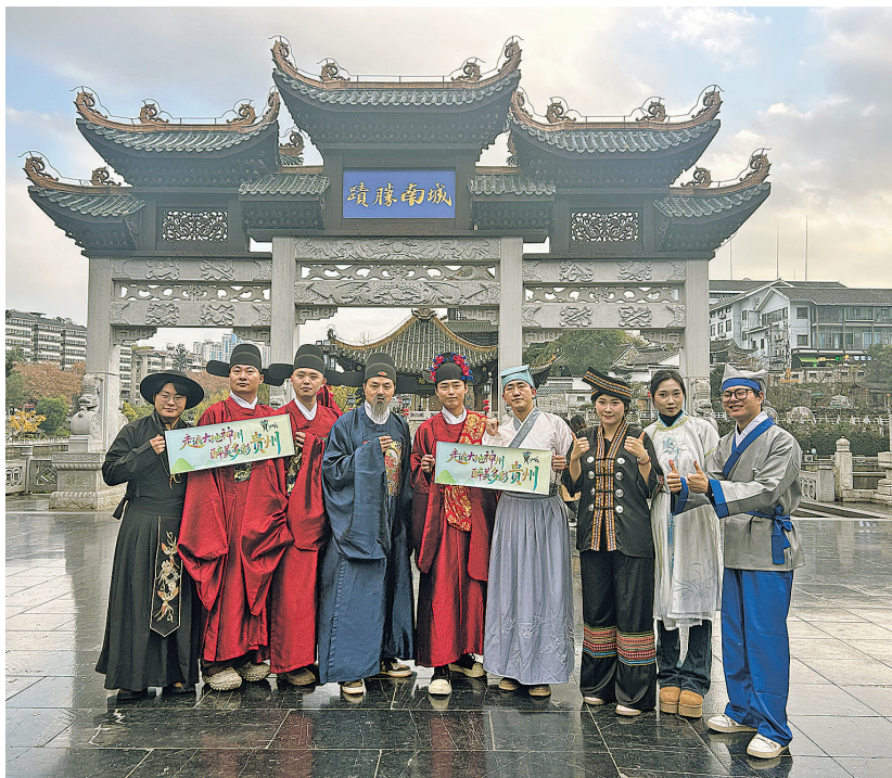
话剧《心光——王阳明传奇之龙场悟道》剧组演员在“城南胜迹”牌匾前合影。

本报讯 “走遍大地神州,醉美多彩贵州,来贵阳必追‘心光’……”12月18日,伴随着地道的贵阳方言宣传口号,大型治愈系话剧《心光——王阳明传奇之龙场悟道》剧组的演员身着古装,现身贵阳地标甲秀楼拍摄剧目宣传物料。