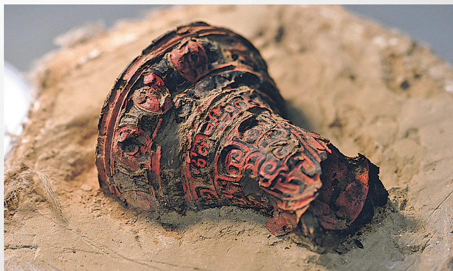
瓦窑沟墓地出土的漆器。