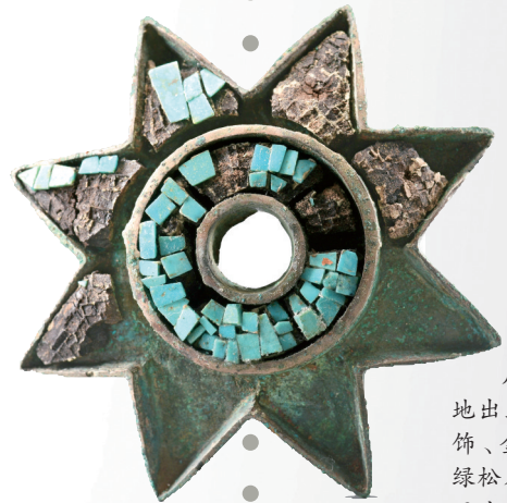
后刘家塔墓地出土的玉兽面饰、金耳环、镶绿松石铜饰以及瓦窑沟墓地出土的铜钺(由上至下)。