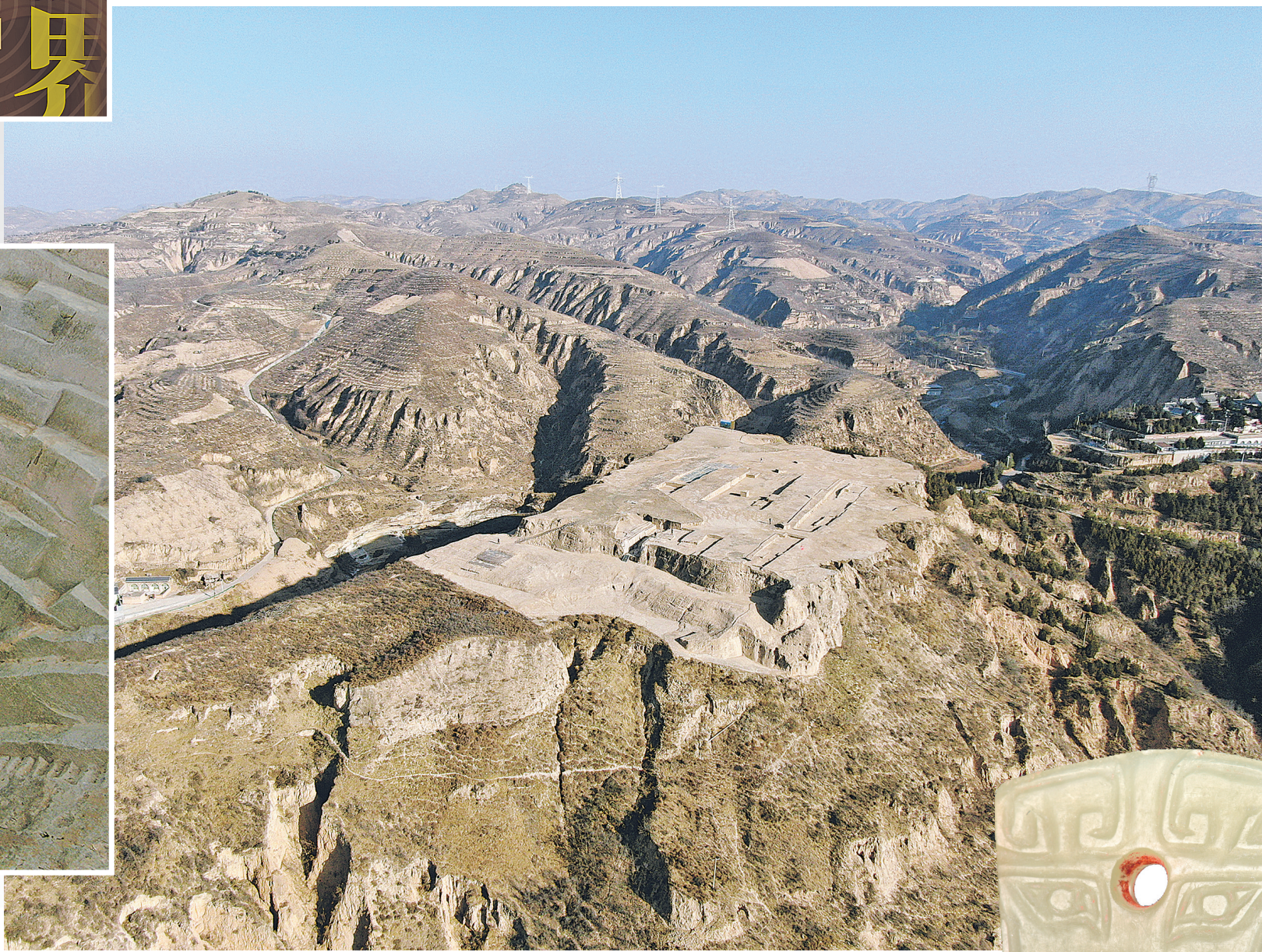
陕西清涧寨沟遗址寨塬盖夯土建筑群。