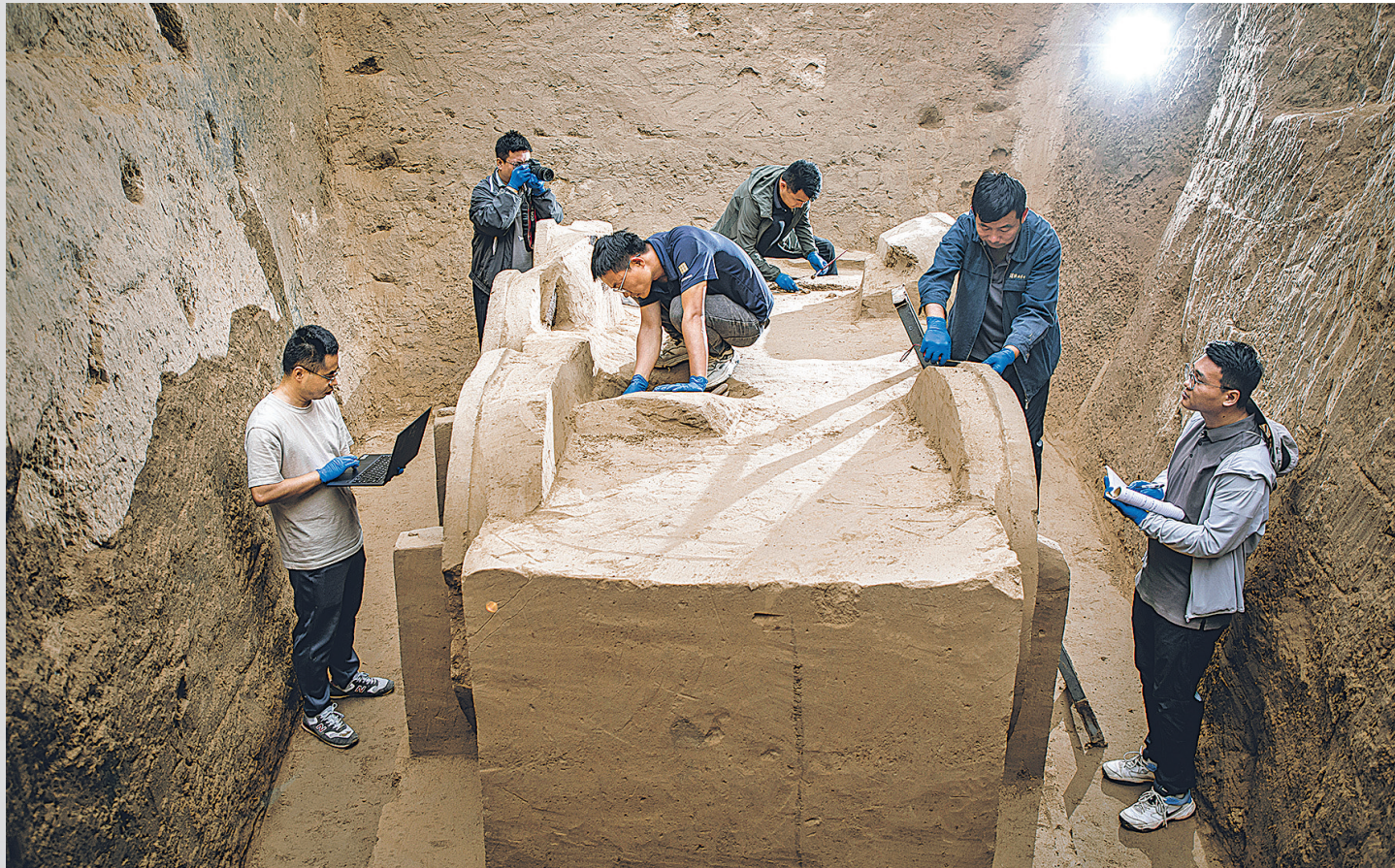
考古队在瓦窑沟墓地M4号墓葬清理马车。