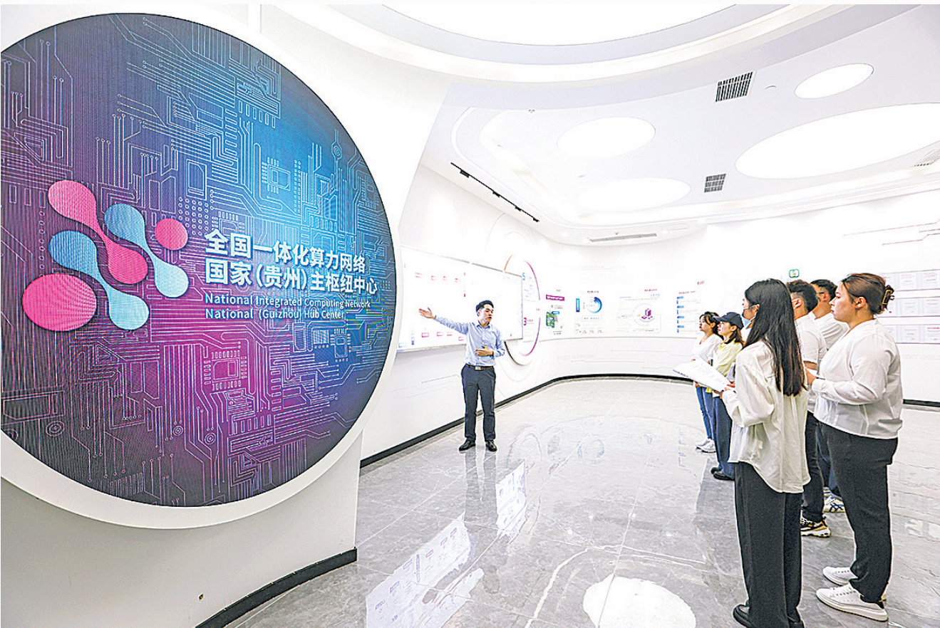
工作人员在全国一体化算力网络国家(贵州)主枢纽中心展厅向观众介绍中心相关情况。

第二十届中国IDC产业年度大典暨数字基础设施科技展由中国IDC产业年度大典组委会主办,中国IDC圈承办,以“重塑算力 破界而生”为主