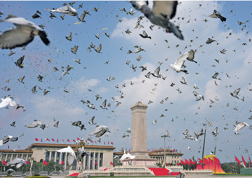
2025年9月3日，纪念中国人民抗日战争暨世界反法西斯战争胜利80周年大会在北京隆重举行。这是纪念大会现场放飞鸽子。