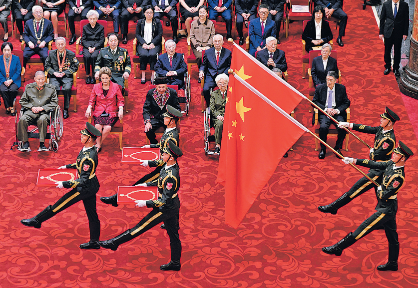
2024年9月29日，中华人民共和国国家勋章和国家荣誉称号颁授仪式在北京人民大会堂隆重举行。这是礼兵护送国家勋章和国家荣誉称号奖章入场。