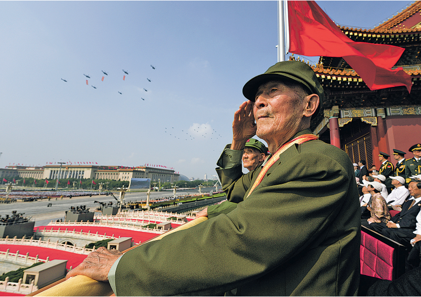
2025年9月3日，纪念中国人民抗日战争暨世界反法西斯战争胜利80周年大会在北京隆重举行。这是抗战老战士在天安门城楼上敬礼。