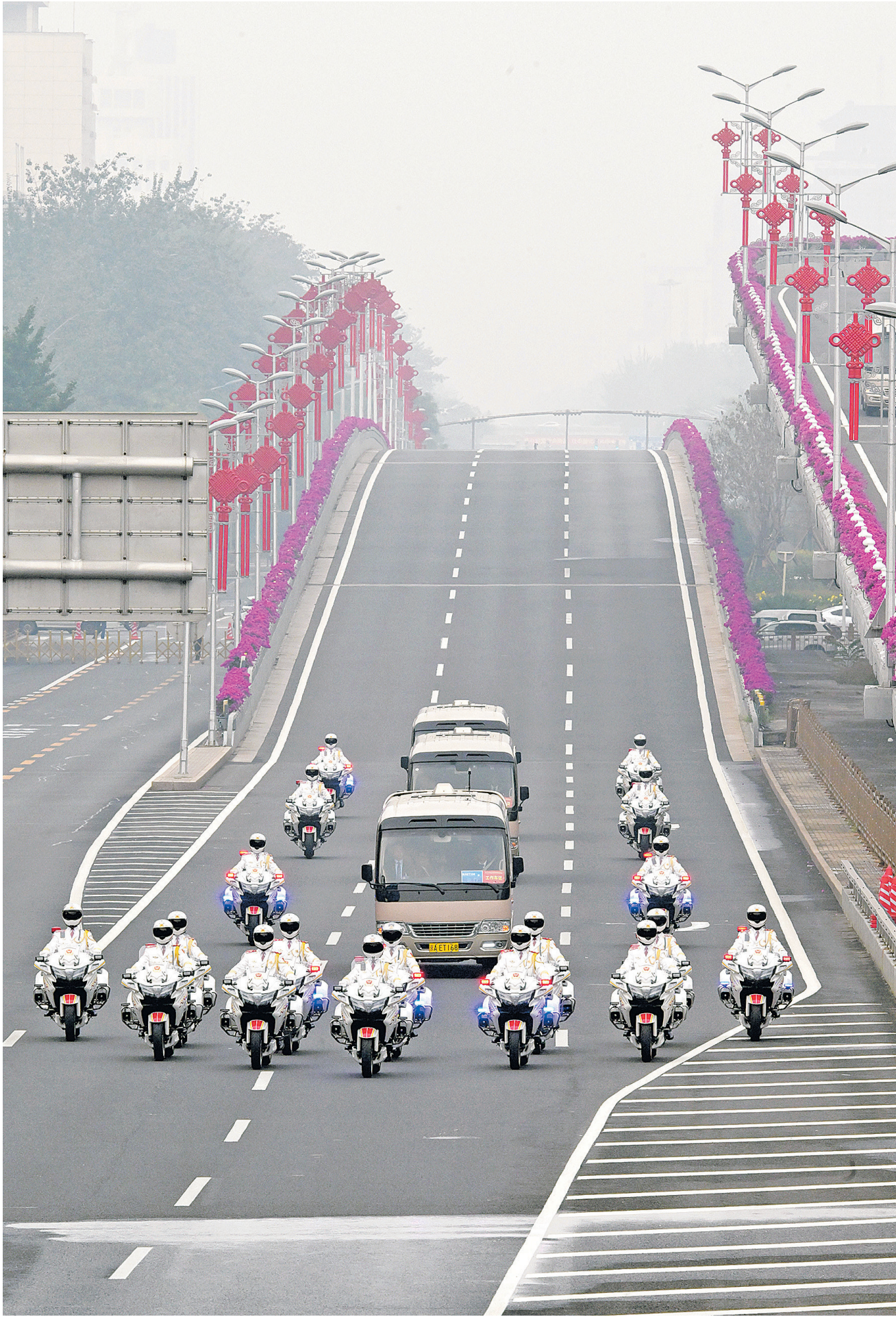
2024年9月29日，中华人民共和国国家勋章和国家荣誉称号颁授仪式在北京人民大会堂隆重举行。这是国家勋章和国家荣誉称号获得者集体乘坐礼宾车，由国宾护卫队护卫前往人民大会堂。

在全场目光的注视中，习近平总书记为塔吉克斯坦总统拉赫蒙郑重佩挂“友谊勋章”。与会嘉宾十多次全体起立，报以热烈掌声。这是中国首次在国外颁授“友谊勋章”。