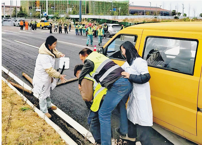
医护人员和救援人员在演练中转移“伤者”。