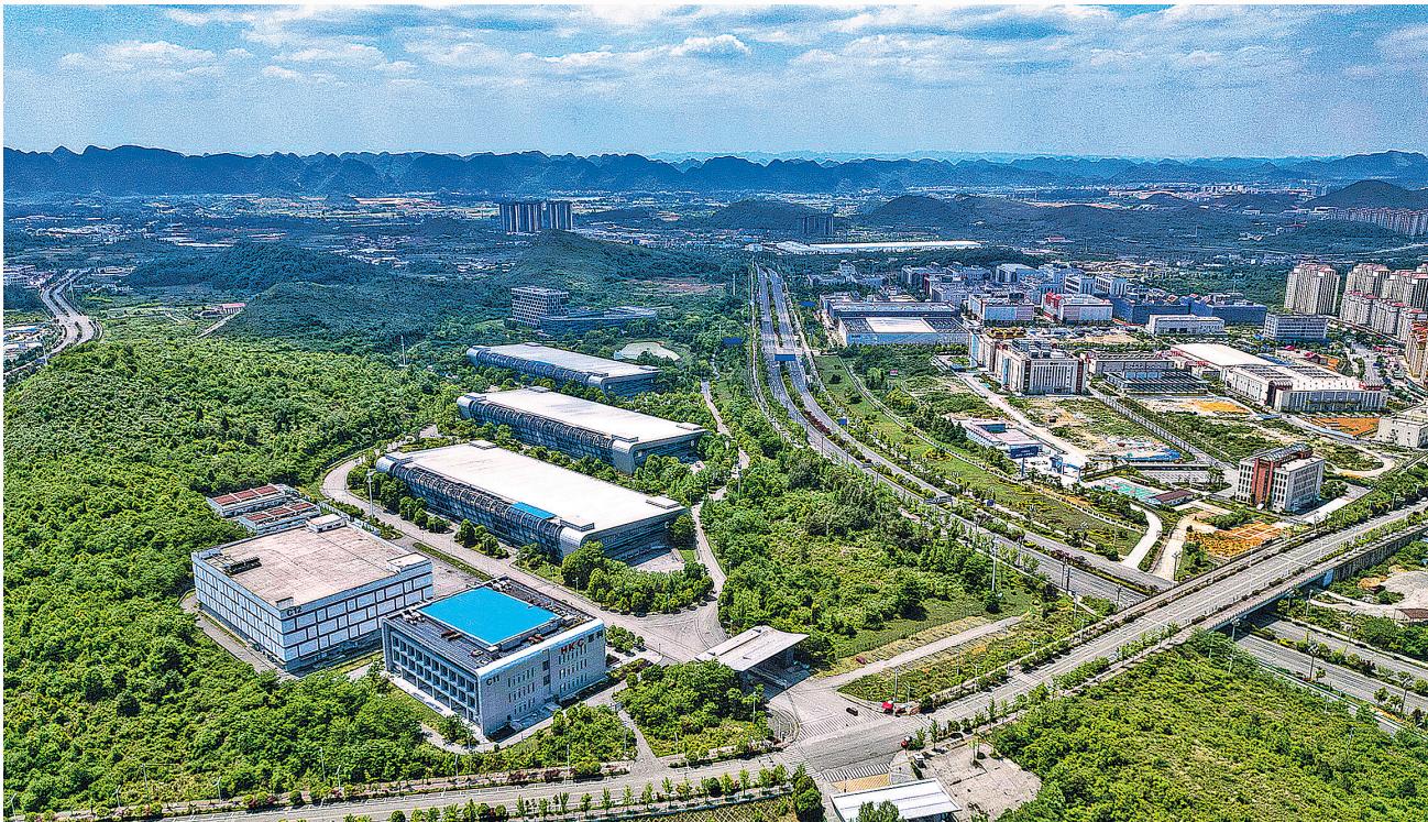
俯瞰贵安综保区一角。

项目是稳增长的“压舱石”,更是促转型的“助推器”。今年以来,贵安综保区始终坚持把项目建设和招商引资作为驱动高质量发展的“双引擎”,聚焦产业链延伸、产业能级提升,以精准招商引资项目、以优质服务促落地,推动一个