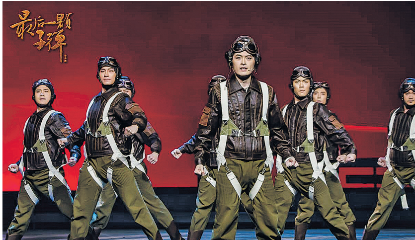
音乐剧《最后一颗子弹》剧照。

作为纪念中国人民抗日战争暨世界反法西斯战争胜利80周年的舞台作品,音乐剧《最后一颗子弹》讲述了22岁的抗日英雄陈怀民,将生命化作“最后一颗子弹”,撞向敌机、壮烈殉国的故事,展现了烽火岁月中的家国情怀。