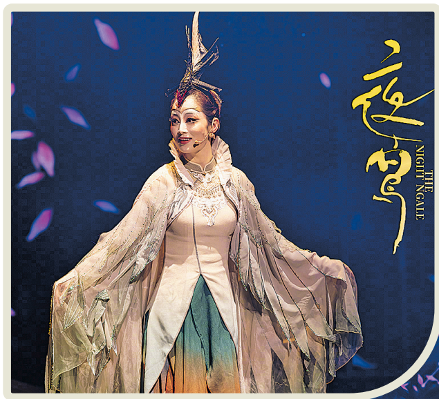
▲夜莺用美妙的歌声为人带去慰藉和快乐。