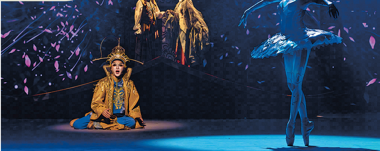
►音乐剧《夜莺》通过运用数字技术与多媒体视觉效果,向观众呈现出美轮美奂的舞台。