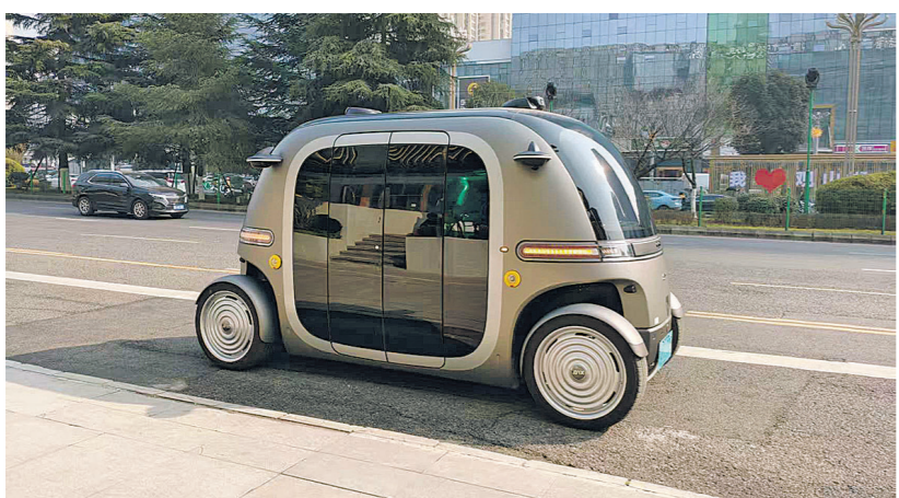
图为无人驾驶小巴在数博大道长岭南路进行安全测试。

本报讯 1月15日,记者从贵阳高新区获悉,该区企业贵州翰凯斯智能技术有限公司 PIX Moving(简称“PIX”)将携手合资公司贵州勘设泰宇坦行科技有限公司,在观山湖区启动“奇遇环线”商业化试点运营。这标志着该企业定义的“自动驾驶移动空间”品类从技术研发迈入城市级商业验证阶段。