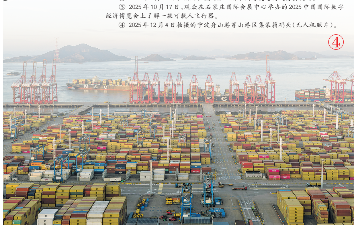
① 2025年11月17日,X9043次中欧班列(西安)驶出西安国际港站,驶向阿塞拜疆首都巴库(无人机照片)。 ② 2025年3月18日在福州拍摄的第五届中国跨境电商交易会现场。 ③ 2025年10月17日,观众在石家庄国际会展中心举办的2025中国国际数字经济博览会上了解一款可载人飞行器。 ④ 2025年12月4日拍摄的宁波舟山港穿山港区集装箱码头(无人机照片)。