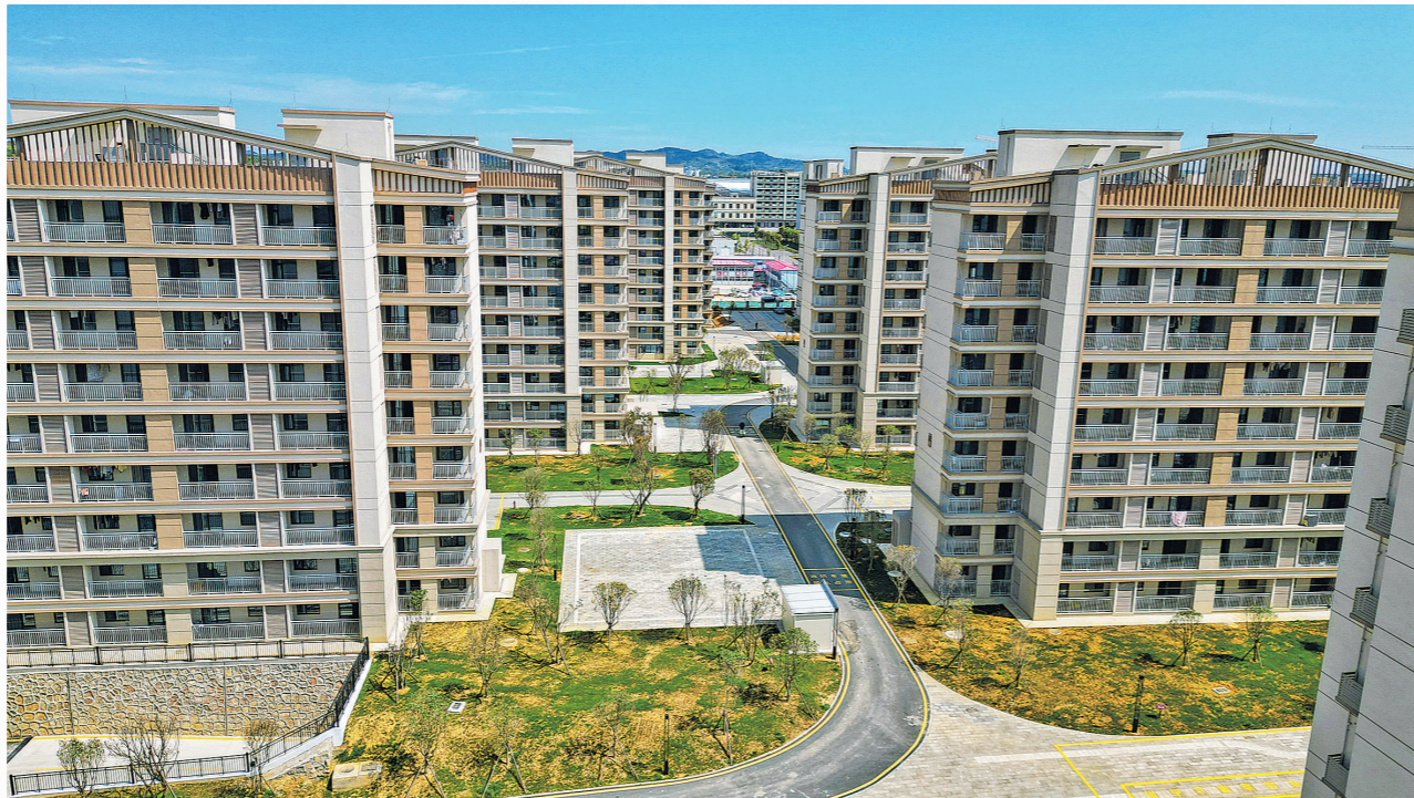
贵安新区安巢·青年社区(云澜店)。

考虑到房源有限,为确保分配过程公平、公正、公开,本次申请延续线上登记、分志愿申请、公证摇号的方式,全程通过“贵安人才通”小程序线上办理。申请对象明确为到贵安新区求职或就业创业的2025届、2026届全日制大专及以上学历高校毕业生(专升本、考研升学人员除外),申请人及其配偶、父母(含配偶父母)、子女须在贵安