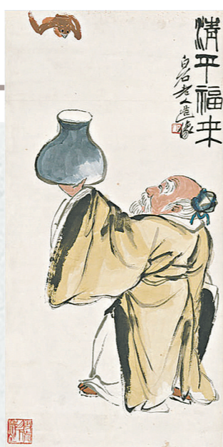
齐白石《清平福来》。北京画院藏