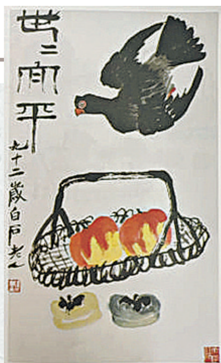
齐白石《世世和平》。中国展览交流中心藏