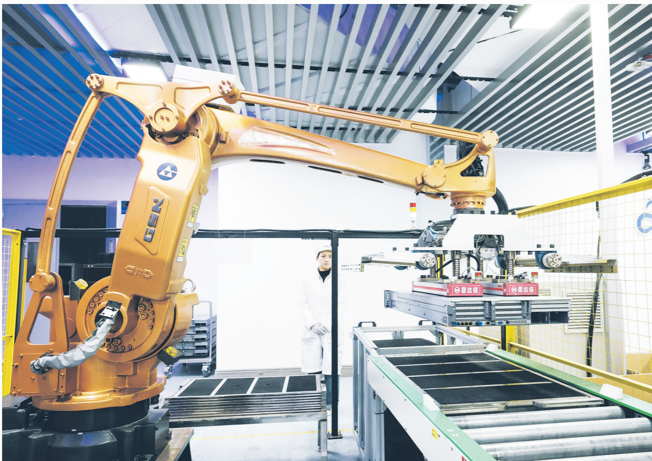
3月13日，在贵州云上鲲鹏科技有限公司车间，机械臂正在输送生产物料。

产能的快速释放，离不开技术创新的坚实支撑。云上鲲鹏始终锚定“AI×鸿蒙”核心战略，依托华为鲲鹏、昇腾AI