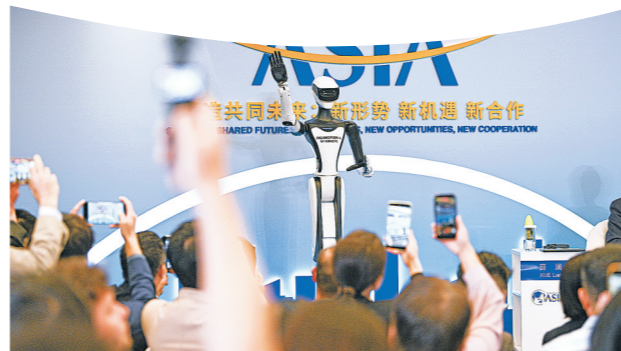
2026年3月25日在博鳌亚洲论坛“人形机器人的进阶与飞跃”分论坛上拍摄的机器人。