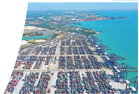
这是2025年11月28日拍摄的海南洋浦港(无人机照片)。