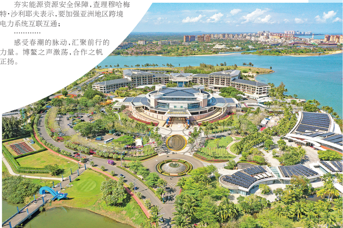
这是2026年3月17日拍摄的博鳌亚洲论坛国际会议中心(无人机照片)。