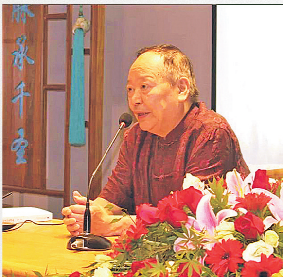
张闻玉生前在讲学中。

3月24日，贵州大学历史系教授、贵州省文史研究馆馆员、著名历史学家张闻玉先生因病逝世。张先生一生以“为往圣继绝学”为己任；问学于“博极群书”的张汝舟先生，是章黄学派在当代的重要传人；采用传世文献（纸上材料）、出土器物（地下文物）与历日天象（天上材料）“三证合一”的史学研究方法，为当代天文历法考据学派代表性学者。“夏商周断代工程”专家组组长、首席科学家李学勤先生曾评价张闻玉的学术工作是“观天象而推历数，遵古法以建新说”。