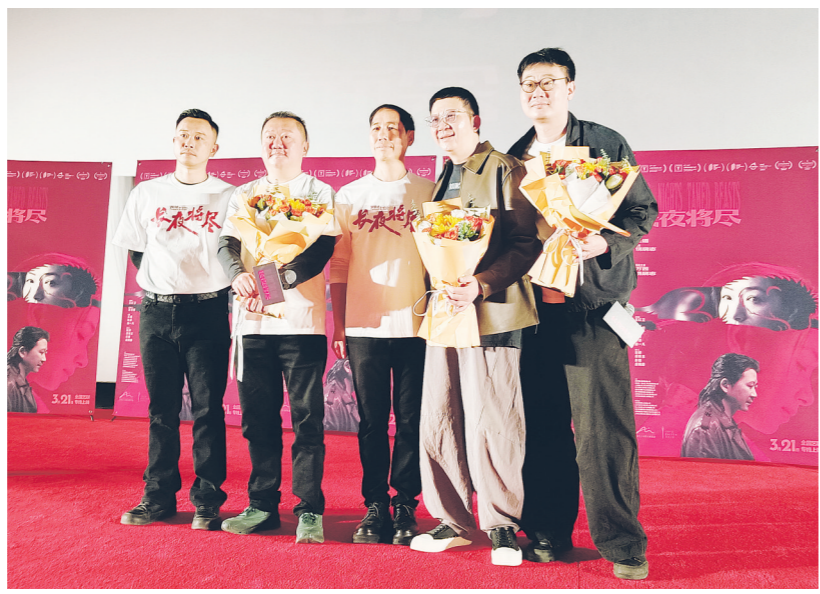
主创团队在路演现场。

作为导演王通的首部长片作品，同时也是饶晓志首度以主演身份亮相银幕的影视力作，《长夜将尽》凭借深刻的主题内核、细腻克制的情感表达，斩获第27届上海国际电影节主竞赛单元评委会大奖、最佳女演员奖等重要荣誉，获得艺术品质与市场口碑双丰收。