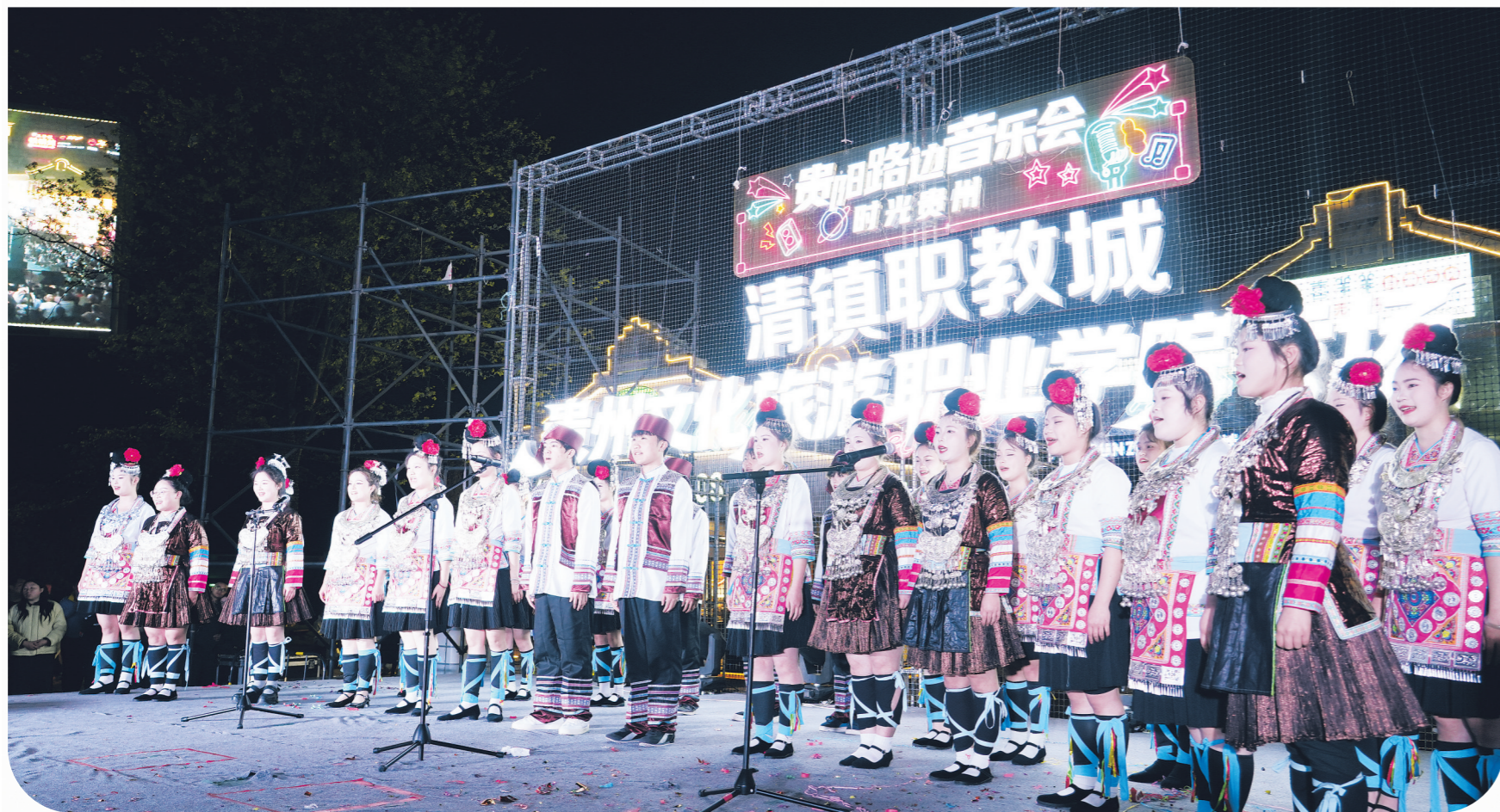
贵州文化旅游职业学院学生表演侗族大歌。

本报讯 3月27日，贵阳路边音乐会·时光贵州“青春文旅 音为有你”清镇职教城贵州文化旅游职业学院专场精彩上演，为现场市民带来了一场兼具青春活力与民族特色的精彩演出。