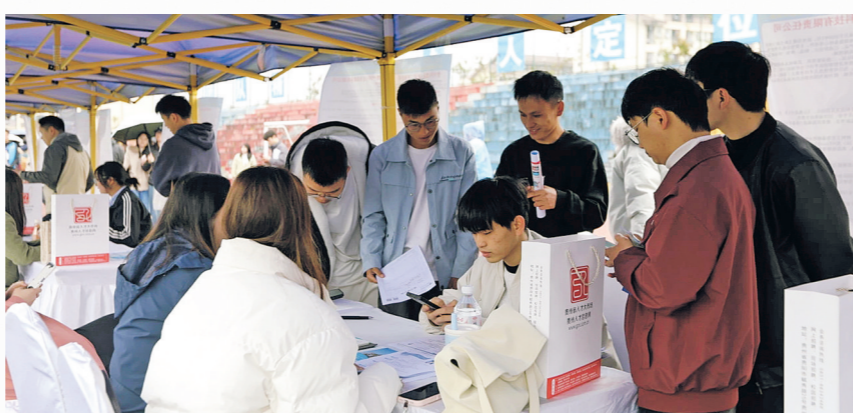
学生在企业展位投递简历。