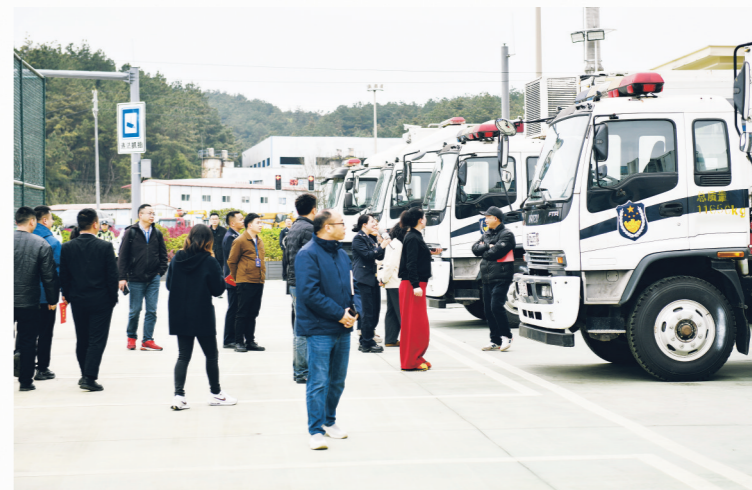
各界代表在公众开放日活动现场参观。

本报讯 3月27日，贵安新区公安局举行公众开放日活动，辖区企业、学校、社区等各界代表受邀参加，零距离感受公安工作成效，共商平安贵安建设之策。