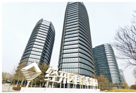
2026年2月9日在北京亦庄拍摄的国家信创园外景。