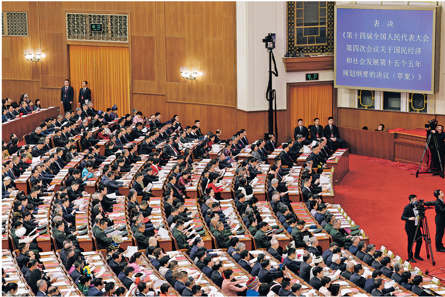
2026年3月12日，第十四届全国人民代表大会第四次会议在北京人民大会堂举行闭幕会。

习近平总书记一系列重要讲话、重要指示，为做好“十五五”规划纲要草案编制工作提供根本遵循。 与“十四五”规划一脉相承，“十五五”规划继续把推动高质量发展确定为经济社会发展主题。 聚焦中心任务：紧紧围绕新时代新征程党的中心任务，强化发展意识，坚持以推动高质量发展为主题，在壮大新质生产力、建设现代化产业体系等方面取得重大突破，推动经济实现质的有效提升和量的合理增长。 注重全局思维：准确把握“十五五”发展所处的历史方位，准确把握国内国际两个大局，保持战略定力，充分估计可能的外部冲击、做好应对准备，牢牢把握发展主动权。 强化民生导向：坚持人民至上，聚焦各方面关切谋划政策举措，奔着解决实际问题去，让群众和企业可感可及。全体人民共同富裕迈出坚实步伐，是指导“十五五”时期经济社会发展的一个总体要求。 胸怀全局、登高望远，在战略上保持定力，在战术上精心运筹。“十五五”规划纲要为不断增强我国发展的确定性和可持续性筑牢行稳致远的实践基础。 这是把握历史规律，充分发挥制度优势的生动实践—— 在“十五五”规划建议和规划纲要的编制过程中，习近平总书记把我们对中长期发展规划的规律性认识提升到新的高度。 全面阐释制定和实施五年规划的重要政治优势：有利于实现党的领导，有利于集中力量办大事，有利于前瞻性把握战略问题，有利于保持事业连续性。 深刻总结长期实践中创造积累的丰富经验：坚持党中央集中统一领导，坚持从实际出发，坚持全国一盘棋，坚持发扬民主、集思广益，坚持规划法定原则等。 坚持问题导向，聚焦突出问题，“十五五”规划纲要编制坚持创新思路、务求实效，谋划提出务实管用的发展载体和工作抓手。 培育壮大高质量发展新动能，围绕成长性、牵引性强的领域打造一批新兴产业新赛道；坚持扩大内需这个战略基点，充分挖掘强大国内市场的潜力；通过全面深化改革释放发展动力和活力，围绕重点领域和关键环节深入研究改革举措；主动开展对外经贸格局的战略性调整，推出更多自主开放、单边开放措