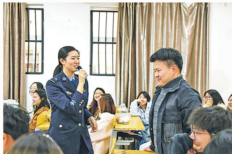
民警在课堂上为学生讲解反诈知识。

本报讯 近日,贵阳信息科技学院联合贵阳市公安局反诈中心、贵安综保区公安局反诈中心共同开展“警校联动护学 反诈宣传全覆盖”专项行动,通过小班宣讲、现场咨询等形式,为全校学生送上“反诈安全课”,进一步筑牢校园安全防线。