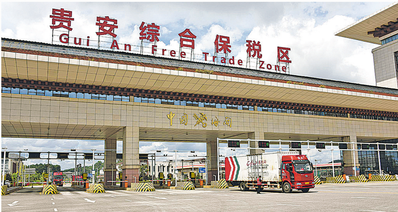
车夫网货车驶出贵安综保区海关卡口。