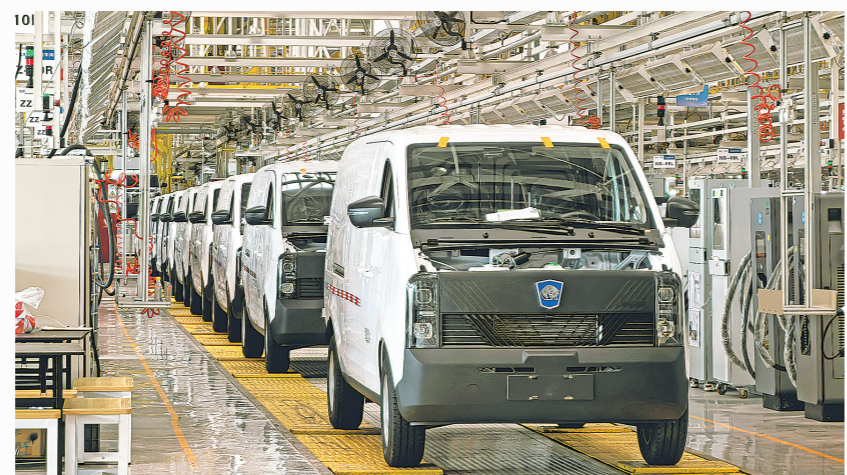
壁虎汽车总装车间一角。

运空间达6.2立方米,较传统车型显著提升。搭载智能车机控制系统,续航里程达305公里,续航效率提升15%,凭借高适配性与智能化优势,迅速打开海外市场。