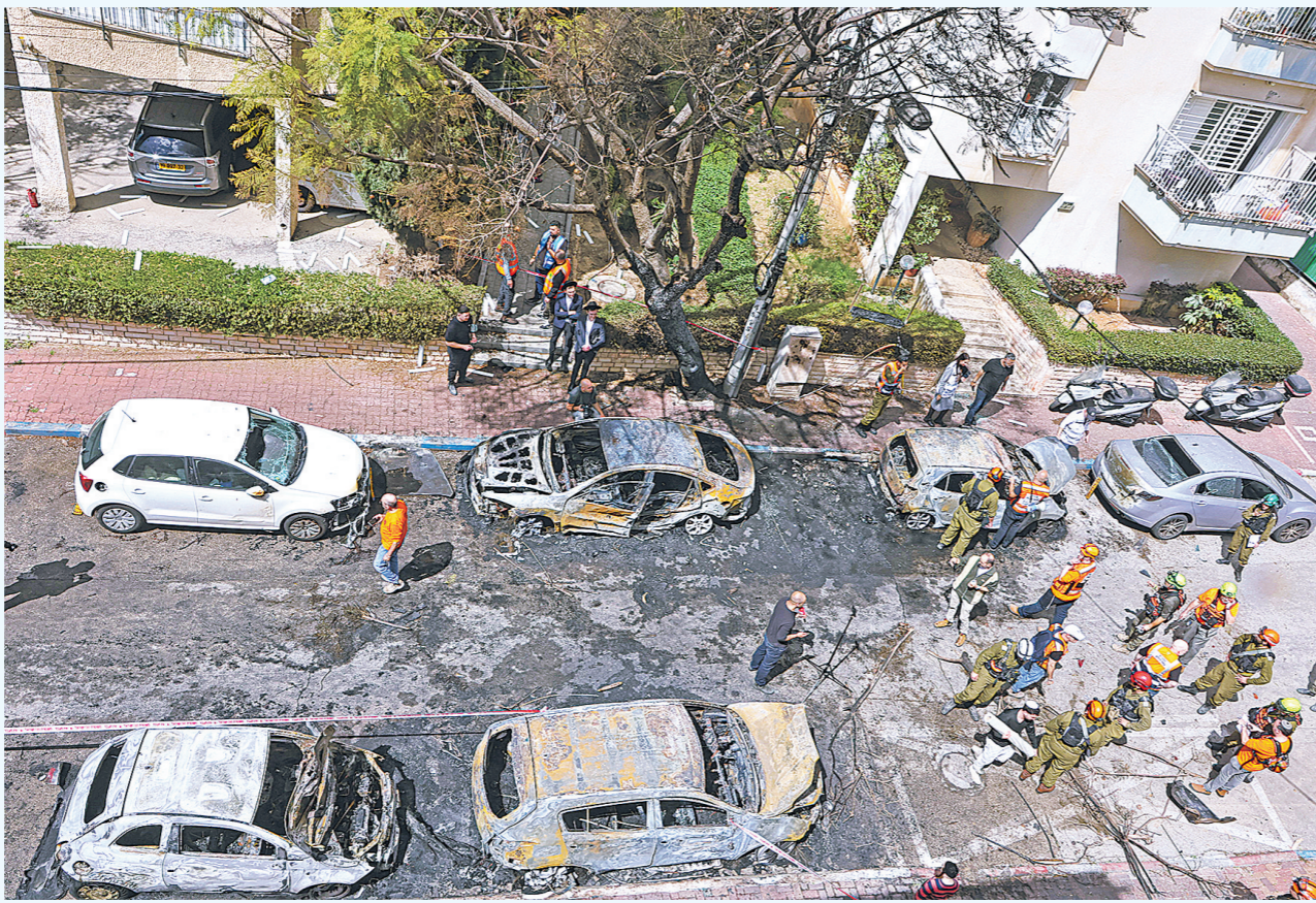
据伊朗伊斯兰共和国广播电视台3月31日报道，伊朗伊斯兰革命卫队海军当天表示，对美以多个目标实施打击，并重申完全控制霍尔木兹海峡。图为3月31日，在以色列中部城市佩塔提克瓦，应急响应人员在导弹袭击现场开展工作。

一方面，乌克兰将无人机技术作为与地区国家互动的“筹码”。乌总统泽连斯基3月下旬出访地区多国，向沙特、阿联酋、卡塔尔等国“推销”无人机技术。乌方还向地区国家派出