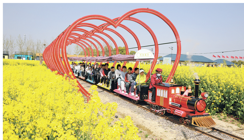
4月4日,游客在江苏省盱眙县黄花塘镇向阳花海乘坐小火车游玩。

人间四月春,风起正清明。旺盛人流穿行于神州大地,喧闹烟火升腾于街市新城,消费活力释放于繁华市井……2026年清明假期,天南海北被奔赴与热爱所点亮,流动的生机与欢歌勾勒出蓬勃向上的假日消费图景,一个生动、饱满的中国于春日中走来。