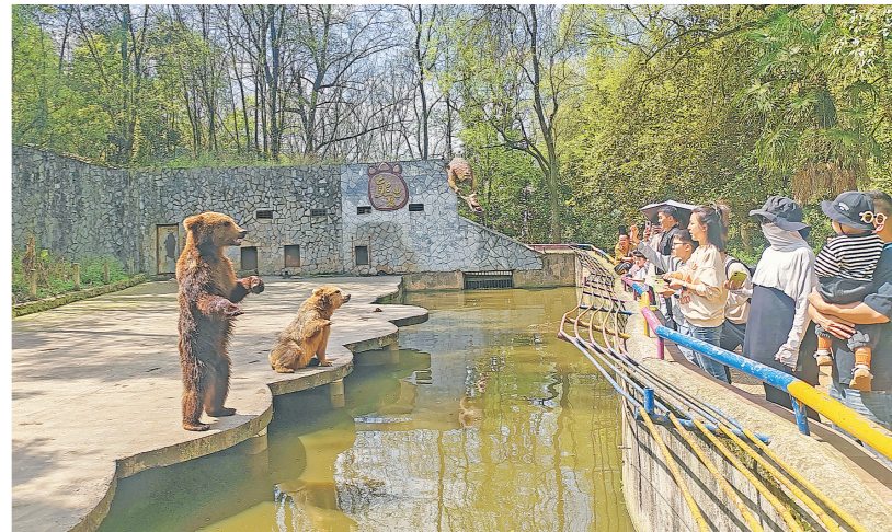
4月4日，游客在贵州森林野生动物园游玩。

本报讯 4月7日，记者从市文化和旅游局获悉，清明假期，全市接待过夜游客超40万人次，同比增长14.6%。