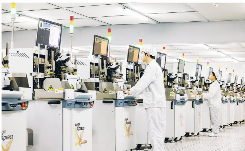
位于贵安综保区的贵州安芯电子科技有限公司生产线。

数据显示，贵安综保区2025年累计办结企业反映的问题诉求245个，办理政务服务事项1052项，完成帮代办服务事项460项，推进“高效办成一件事”58