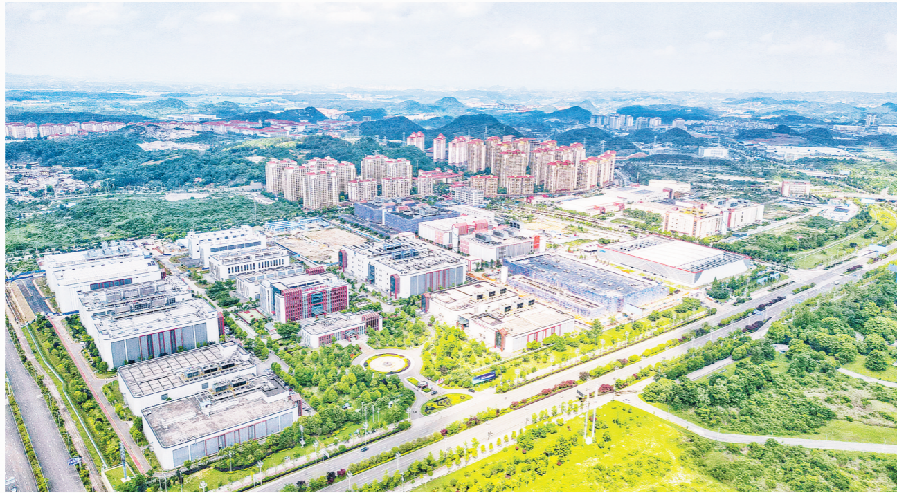
俯瞰马场产业新城。

同样于2016年落户的晶泰科(贵州)光电科技有限公司(以下简称晶泰科),则见证了贵安综保区产业链从“单