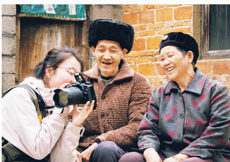
大学生志愿者向村民展示全家福照片。

本报讯 近日,贵州师范大学“1家1”全家福拍摄团、“画笔筑绿·笔墨春秋”志愿服务团的60余名大学生走进贵安新区马场镇松林村,开启为期三个月的乡村社会实践。