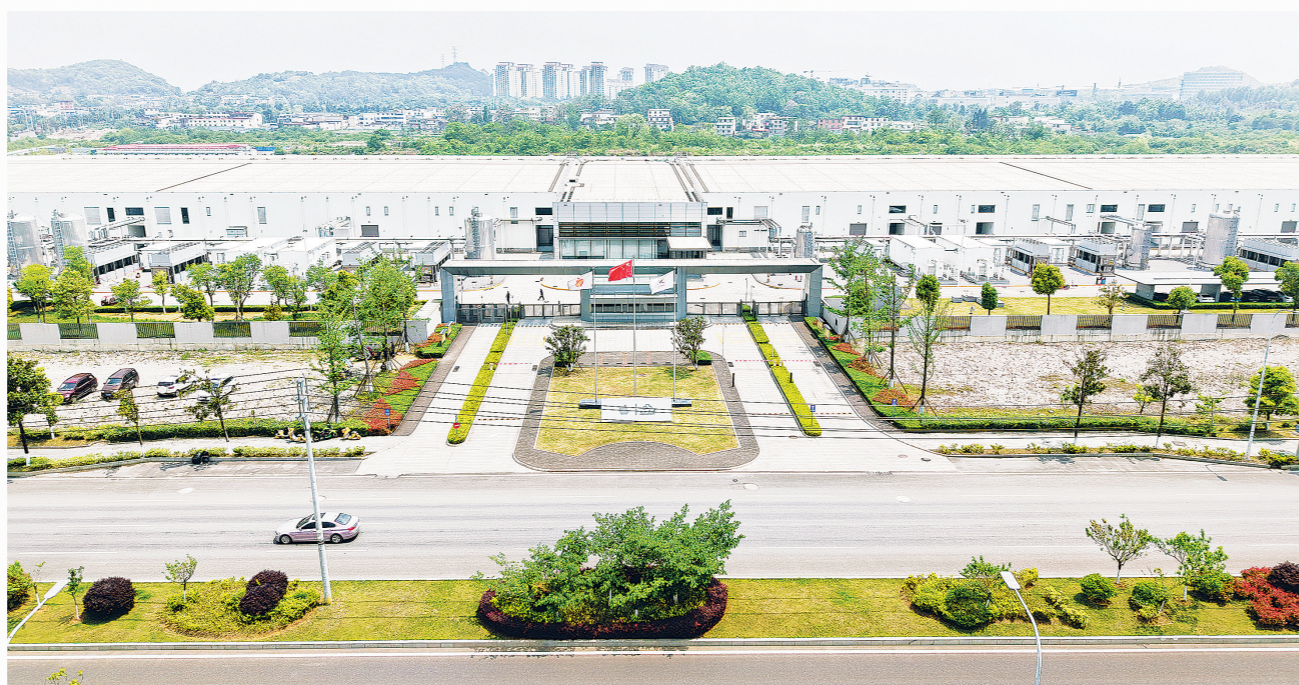
iCloud中国(贵安)数据中心。

在智慧环保管理层面,项目依托智能监控平台,实现用水全流程动态监测、精准计量、智能调控,配套建立“日统计、周分析、月总结”工作机制与三级水管理架构,形成“测试-诊断-创新-优化”的持续改进闭环,将节水工作从单一技术工程升级为制度化、长效化、可迭代的环保管理体系,真正实现精细化管理、低碳化运营,为行业节水管理提供了科学范式。