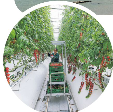
▲村民在位于浙江省宁波市黄湾镇的浙江光禾智谷生态农业有限公司玻璃温室内存摘番茄(2026年4月15日摄)。