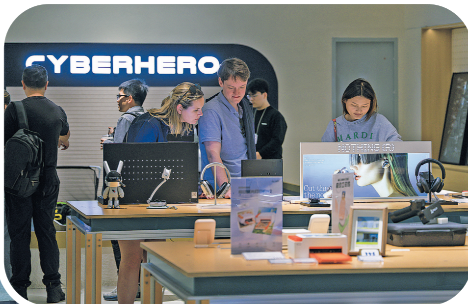
▲顾客在广东深圳市南山区的INNO100全球创新旗舰店体验电子产品(2026年1月5日摄)。