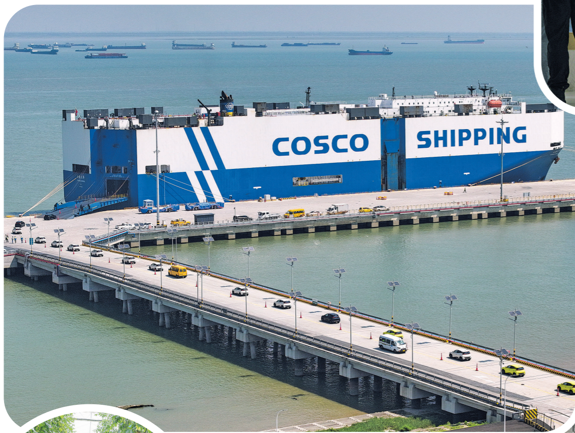
▲在江苏太仓港,装载3600余辆商品车的“玉衡先锋”号即将启程前往东南亚(2025年9月16日摄,无人机照片)。

嘉宾们表示,要紧密团结在以习近平总书记为核心的党中央周围,更加充分发挥经济大省挑大梁作用,以更大作为扛起国家重任,以优异成绩护航“十五五”良好开局,为中国经济社会高质量发展注入源源不断的奋进力量。