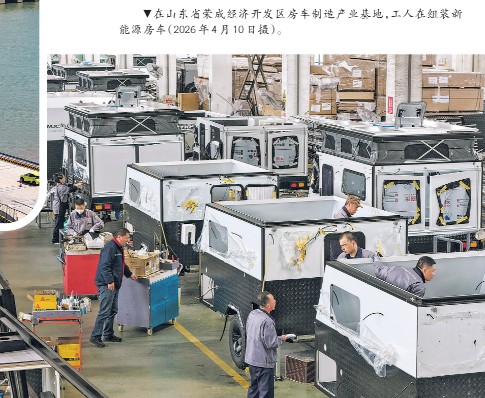
▼在山东省荣成经济开发区房车制造产业基地,工人在组装新能源房车(2026年4月10日摄)。