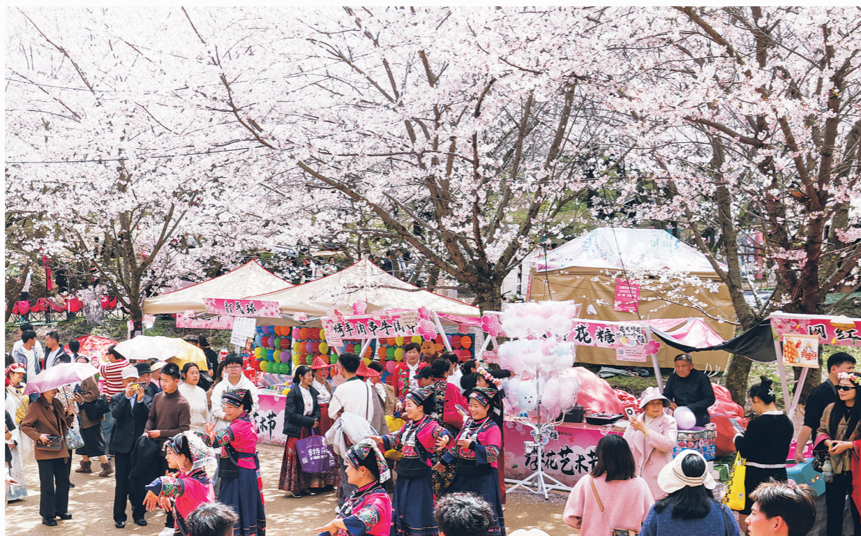
今年赏樱季期间,贵安樱花园在园内设置特色摊位,为游客提供多元消费选择。

本报讯 记者从贵安新区投资促进局(商务局)获悉,一季度,贵安新区紧扣梅花、樱花两大特色文旅IP,深挖传统消费旺季及节假日潜力,通过政策精准落地、特色场景打造与商业项目集中招商,持续丰富消费场景,实现“季季有主题、月月有活动”。 一季度,贵安新区将消费品以旧换新作为拉动内需、活跃市场的重要抓手,通过线上线下全覆盖宣传,并组织力量深入乡镇一线举办9场系列促销活动,确保政策红利精准直达基层。数据显示,一季度,新区累计兑现以旧换新补贴优惠115.52万元,直接拉动相关消费2249.18万元。新区企业牛淘车以周年庆为契机,开展汽车促销活动,单场活动吸引客流1.5万人次,现场成交汽车118台,成交金额达966万元,不仅有效激发了新区大宗消费活力,更对一季度零售增长形成了有力支撑。 在用好用政策工具的同时,贵安新区敏锐地捕捉到春季“赏花经济”的流量机遇。一季度,贵安樱花园与贵州梅园胜景持续出圈,新区顺势围绕“购在中国——多彩贵州欢乐购”主题,策划推出“贵安有礼·不负梅景”“购享贵安·樱你美丽”“浪漫樱花·寻味贵安”等7场主题促销活动。同时,采用“政府消费券+企业票根经济”联动模式,政府投入31万元消费券作为“助燃剂”,引导餐饮、零售、住宿等商家叠加让利优惠,这一举措有效延长了游客在新区停留的时间,成功将“赏