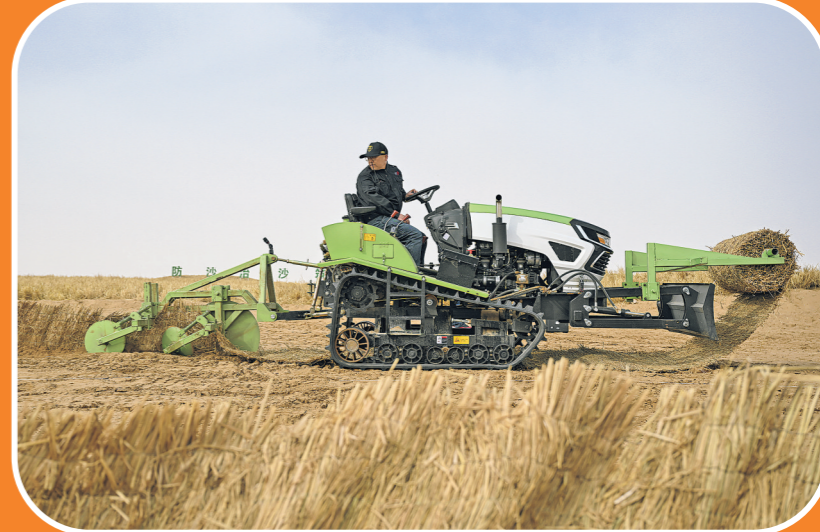
2026年2月28日，工人在内蒙古阿拉善盟境内的乌兰布和沙漠驾驶小型履带沙障机作业。