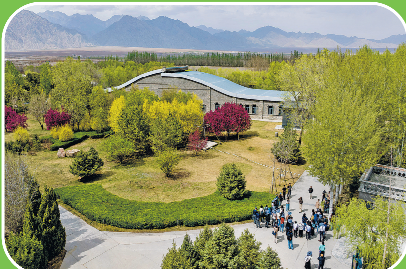
2026年4月13日，荒漠化防治技术与实践国际研修班成员在宁夏银川市一家酒庄内参观(无人机照片)。