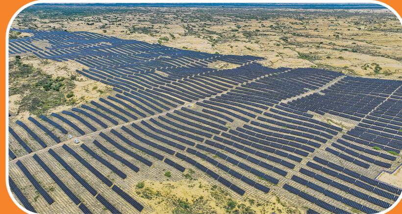
在内蒙古赤峰市敖汉旗敖汉旗苏木沙地上建起的光伏发电项目(2024年5月16日摄，无人机照片)。