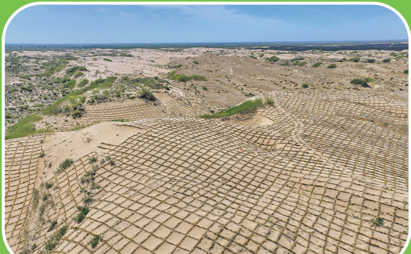
在内蒙古赤峰市敖汉旗敖汉旗苏木，科尔沁沙地内的沙丘被草方格固定(无人机照片，2024年5月16日摄)。