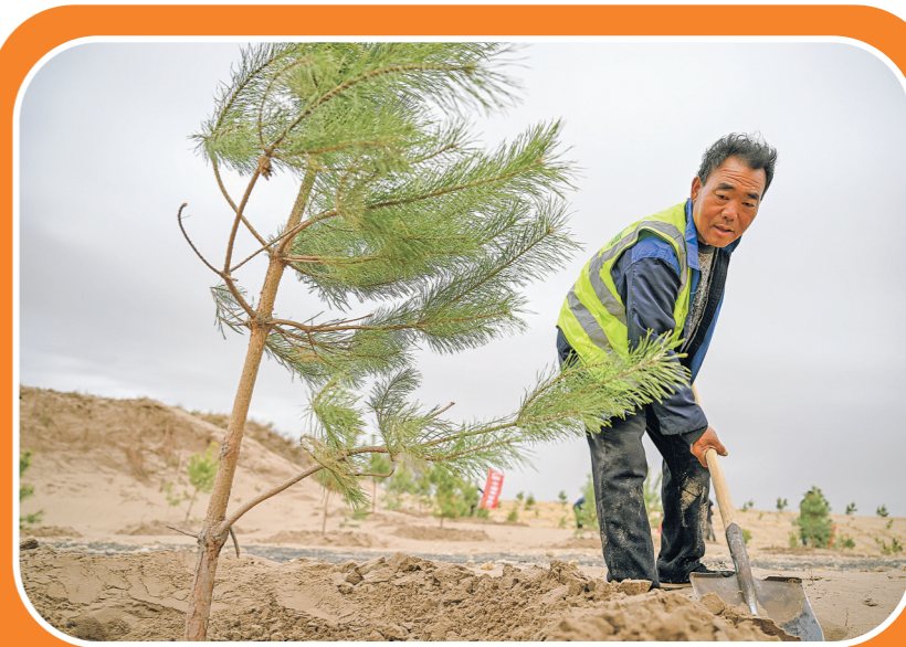
2026年4月19日，治沙工人在内蒙古通辽市科尔沁沙地东力古台防沙治沙项目区植树。