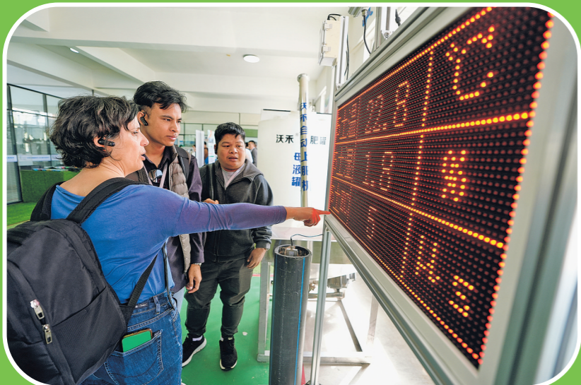
2026年4月13日，荒漠化防治技术与实践国际研修班成员在宁夏银川市一家节水灌溉设备生产企业参观玻璃监测设备。