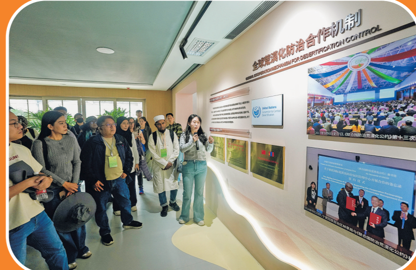
2026年4月13日，荒漠化防治技术与实践国际研修班成员在位于宁夏的中国—中亚荒漠化防治合作中心参观。