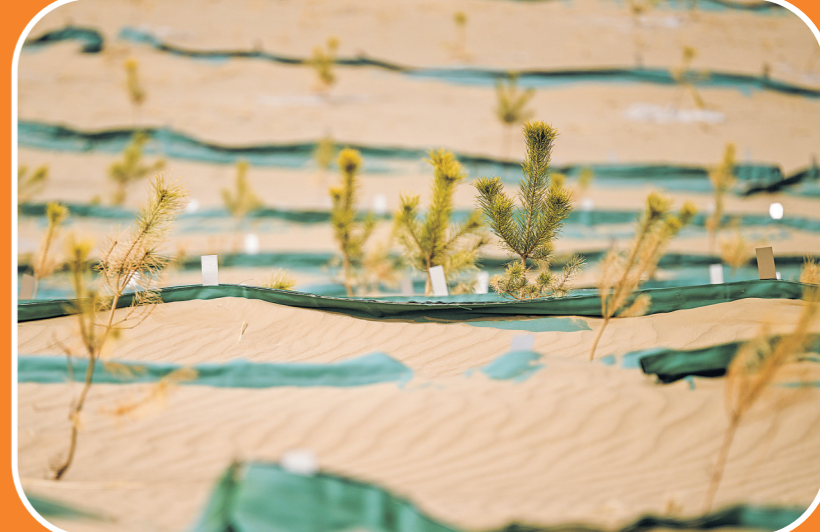
2024年3月27日在内蒙古通辽市科尔沁区大林镇科尔沁沙地治理项目区拍摄的栽植在羽翼袋沙障内的樟子松。