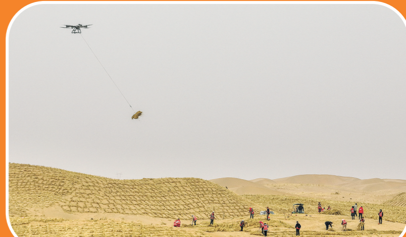
2026年2月28日，无人机在内蒙古阿拉善盟境内的乌兰布和沙漠运送草料(无人机照片)。