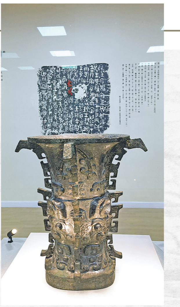
陕西宝鸡青铜器博物院的何尊。

风、造型感与实用性兼具的画架桌、妙趣横生的二十四节气动画等设计作品，呈现于线上线下，应用于日常，并集成展览展示给不同国家和地区的民众。