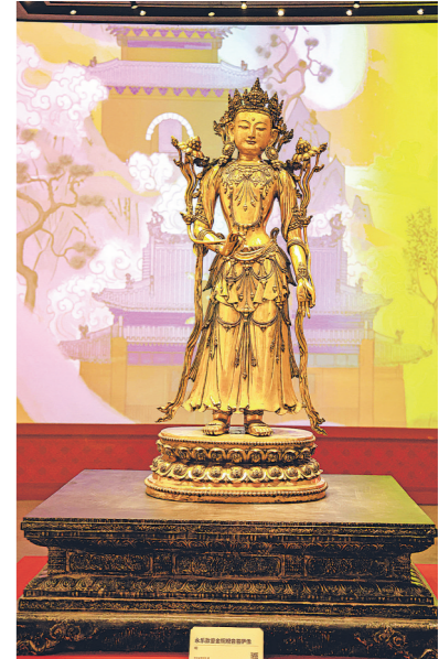
明永乐款鎏金铜观音菩萨像。