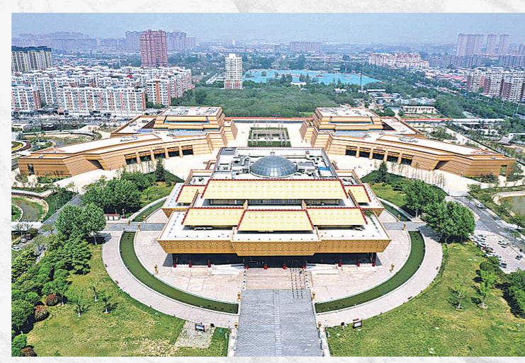
位于河南省安阳市的中国文字博物馆。

在清华大学中国古文字艺术研究中心，古文字早已融入“设计学”坐标，成为制作精美的甲骨文镂空屏