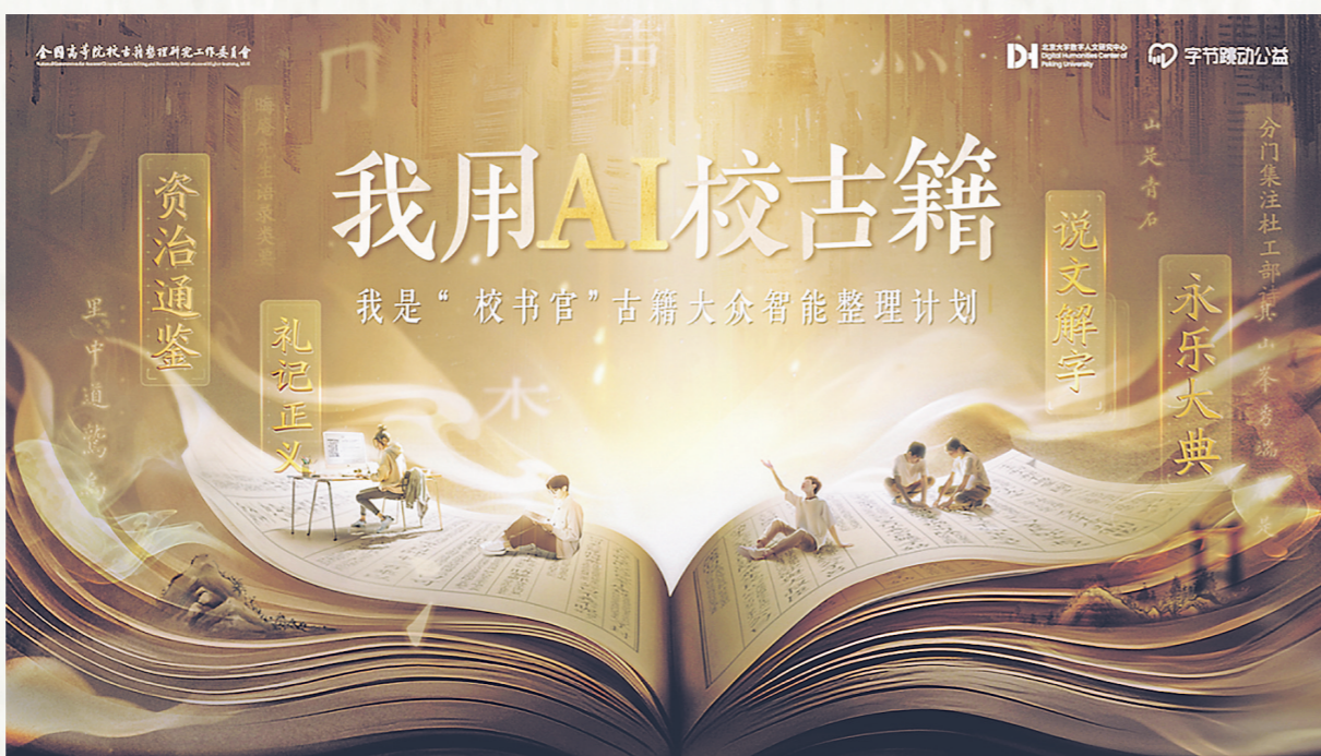
古籍大众智能整理计划吸引众多志愿者成为“校书官”。

有一次,他和队友遇到了一句诗——“小桃明淑?”,AI系统未能识别出问号处的字,前端的初阶志