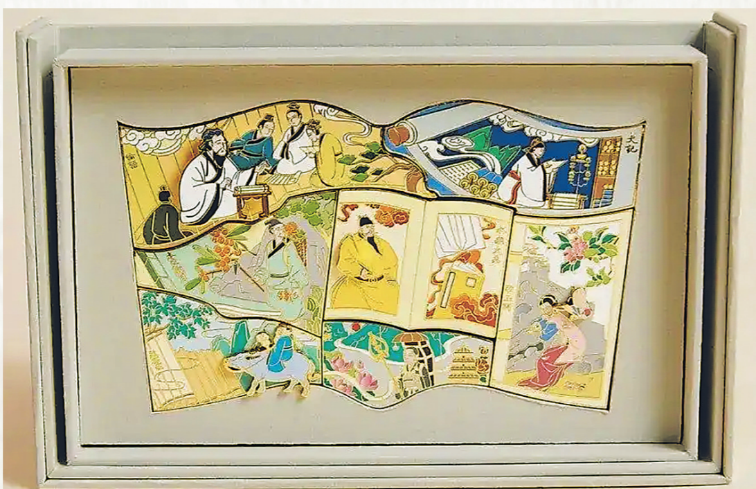
“校书官”计划为志愿者准备的纪念品文创。