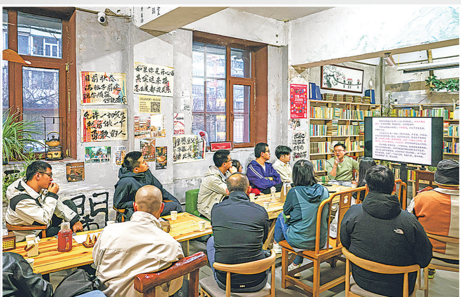
▼书友们在店内进行读书分享活动。