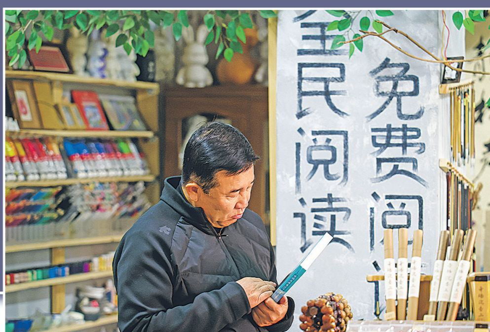
◀一位书友在店内选购书籍。