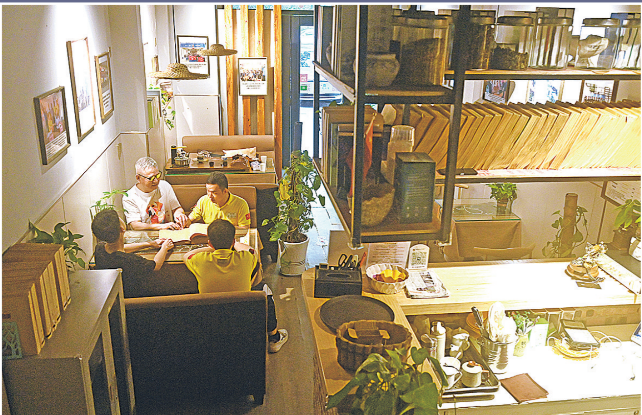
▲视障人士在盲人读书角读书学习。