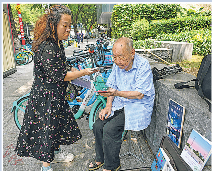
▲一名读者在林宝山的路边书摊扫码买书。