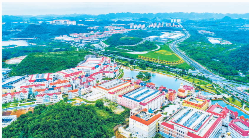
俯瞰华为云贵安数据中心。

高效算力调度离不开高速便捷、通达全国的网络支撑。目前，贵州已建成投用贵阳贵安至宁波的全长首条400G超宽带算力通道，贵阳贵安国家级骨干直联带宽扩容至1700Gbps，与全国42座核心城市实现网络直达，互联网出省带宽提升至6.114万Gbps。“省内3毫秒、粤港澳10毫秒、长三角及京津冀20毫秒”的三层时延圈全面建成，贵安新区的澎湃算力实现“毫秒级”通达全国，为