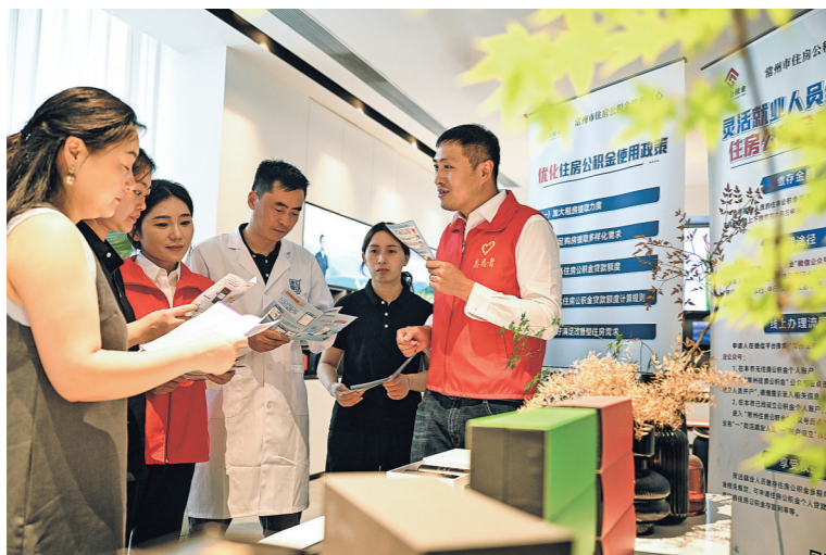
2025年5月8日，江苏省常州市住房公积金管理中心工作人员为一家企业的员工介绍公积金政策。