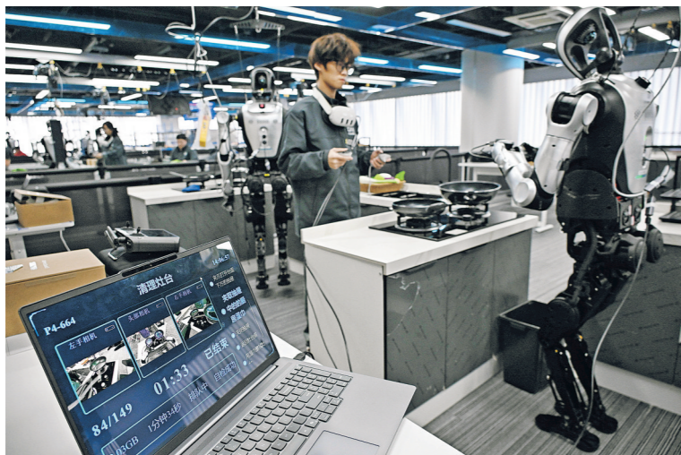
2026年3月23日，在山东省青岛市人形机器人数据采集训练场，训练师在居家收纳场景内指导机器人进行训练。

中共中央政治局4月28日召开会议，分析研究当前经济形势和经济工作，强调“以更大力度和更实举措抓好经济工作”“增强经济发展内生动力”，并作出一系列重要部署，为进一步坚定发展信心、牢牢把握发展主动、努力实现“十五五”良好开局指明前进方向。