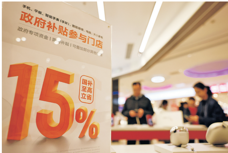
2026年2月21日，消费者在山东省枣庄市一家手机专卖店选购手机。