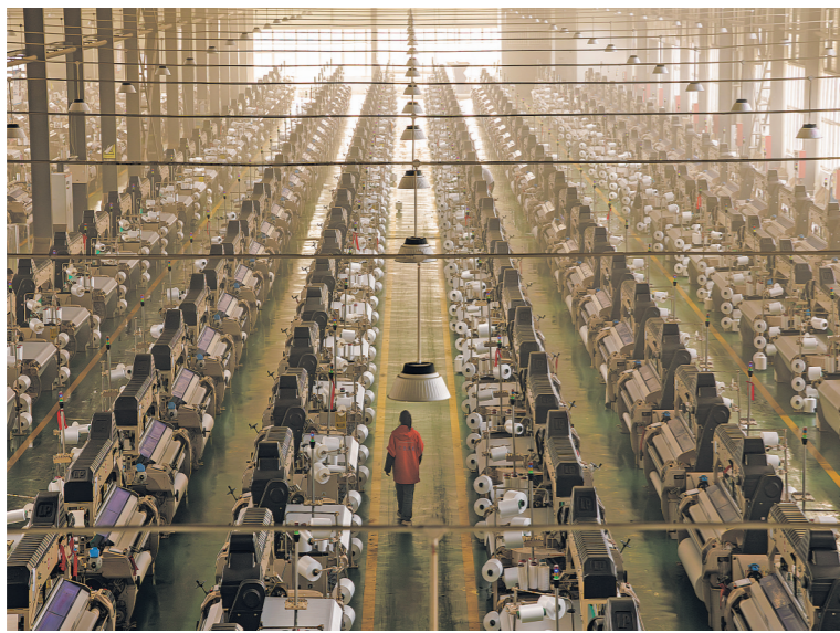
2026年4月17日，在贵州省毕节高新技术产业开发区一家纺织企业内，机器开足马力全力生产。