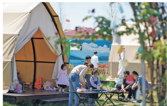
▲2026年4月4日，游客在山东省滕州市龙阳镇“龙湖月色”省级乡村振兴齐鲁样板片区内露营休闲。