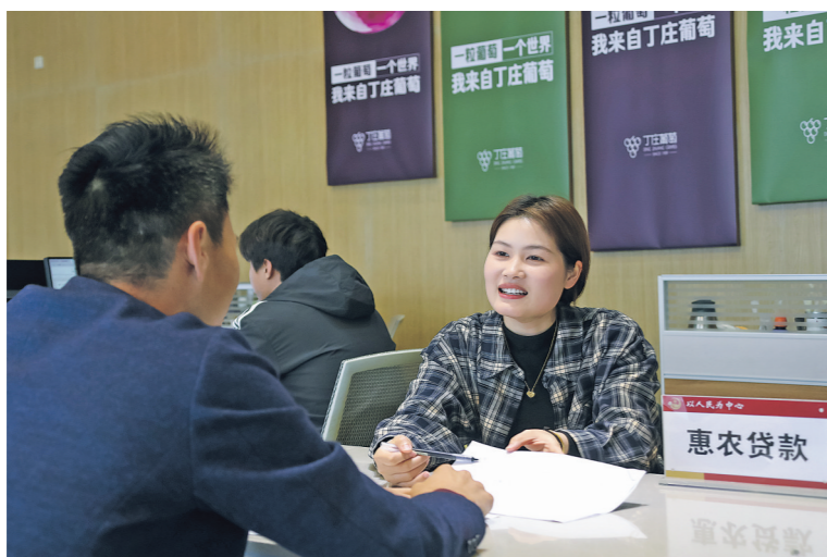
2026年4月17日，在江苏省句容市丁庄万亩葡萄专业合作社服务大厅，工作人员(右)向葡萄种植户介绍惠农贷款的相关政策。